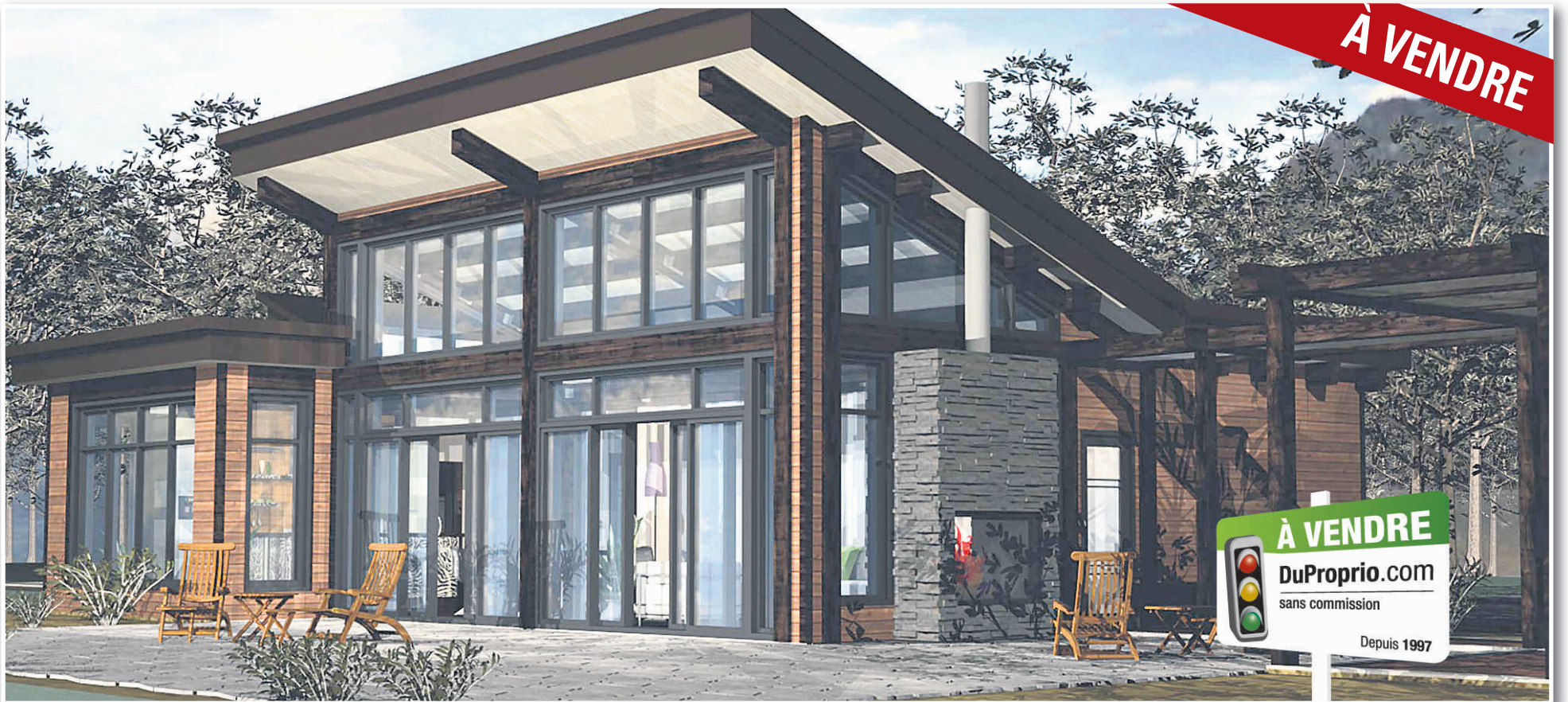
Ce chalet comporte un garage attaché au corps principal. Il y est relié par la grande marquise qui vient marquer l'entrée principale.