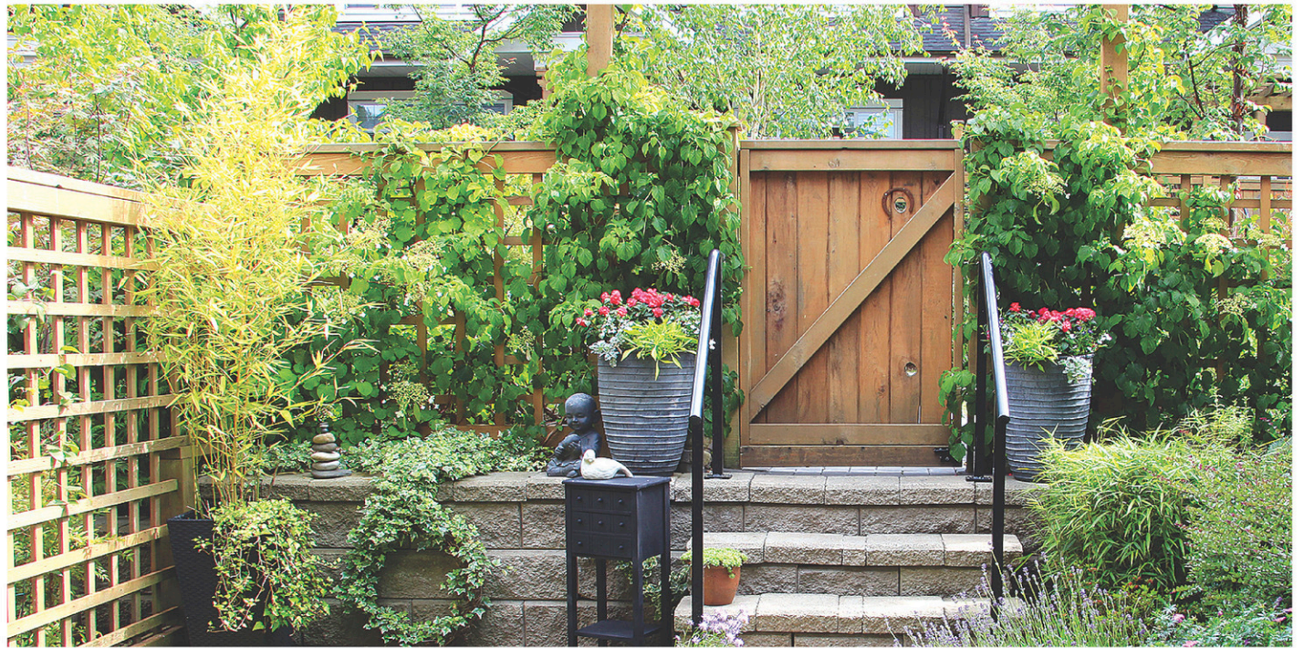
Graminées et plantes grimpantes, notamment, sont de précieuses alliées pour se soustraire aux regards curieux!

façons de vous mettre à l'abri des regards. Bref, avec un peu d'imagination, vous pouvez facilement réaliser un aménagement paysager qui vous permettra de créer en beauté quelques zones d'intimité!