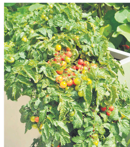
Tomate Tiny Tim.

La culture de tomate chez soi ne devrait pas avoir de limites. Avec toute la controverse de transformation, de commercialisation et de production mondiales entourant ce fruit, la culture de tomates chez soi nous assure de consommer un produit sain et de qualité, tout en nous procurant le plaisir d'être entouré de verdure.