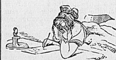
La Carnardière, 20 Janvier.