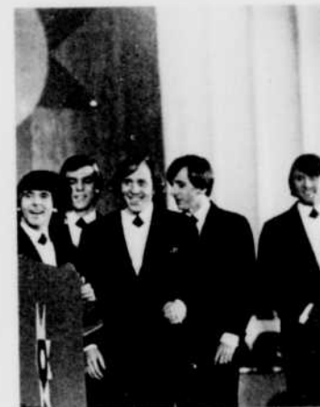
LES HOU-LOPS, connus anciennement sous le nom des Têtes blanches, seront à l'émission « Les Copains d'abord » de « Jeunesse oblige », le mercredi 19 avril à 6 heures. Michel Trahan recevra également un autre groupe, les Sultans.