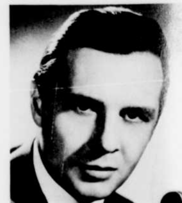
CESARE SIEPI chantera le rôle vise, dans «La Gioconda» de Ponchielli, au «Metropolitan Opera», diffusé samedi après-midi à 1 h. 30.