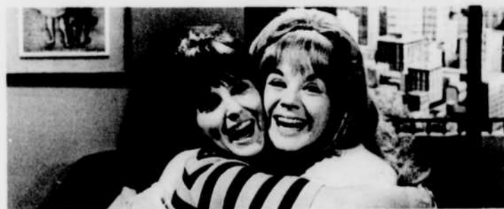
Tout heureuses que «Moi et l'autre» ait remporté le prix Mandarine, Denise et Dodo, les deux vedettes de la série, cessent de se chamailler, pour une fois, et se jettent dans les bras l'une de l'autre.