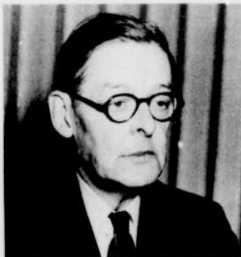
THOMAS STEARNS ELIOT dira son poème «Marina», aux «Cours universitaires» sur la littérature anglaise, le samedi 15 avril à 10 h. 45.

Des circonstances imprévisibles peuvent entraîner des changements après la publication de ces horaires.