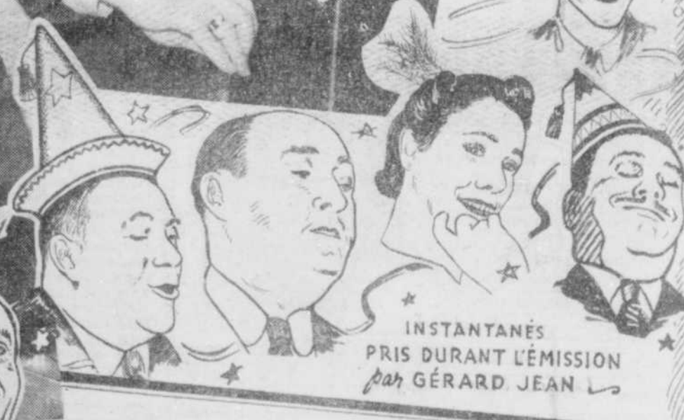
INSTANTANÉS PRIS DURANT L'ÉMISSION par GÉRARD JEAN