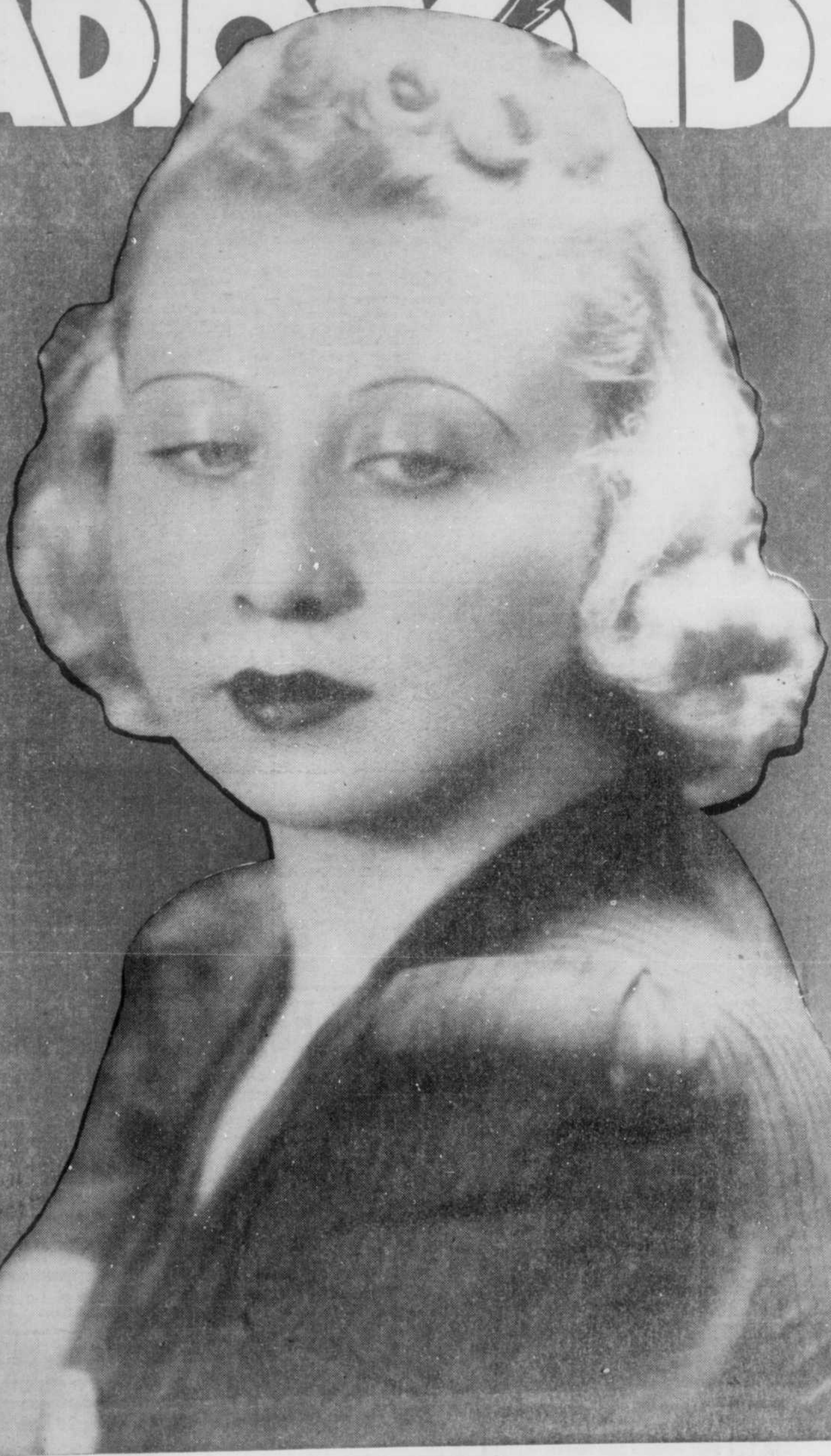
ANTOINETTE GIROUX, vedette de "La Comédie de Mont réal" VOL. III NUMERO 49 MONTREAL, 23 NOVEMBRE 1941