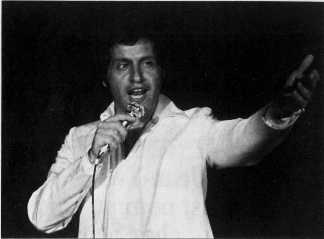
Photo prise en 1979 à l'hôtel Cosmos de Moscou du chanteur franco-américain Joe Dassin.

Spectacle-hommage en première à Québec l'automne prochain