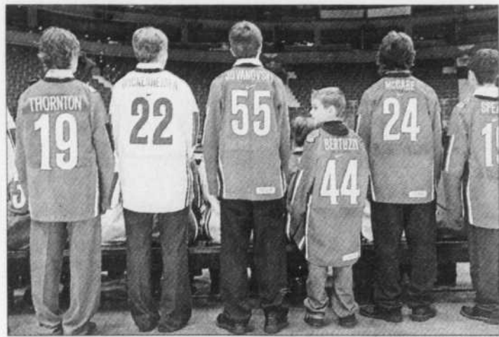
Des jeunes avec des dossards présentaient les noms des joueurs choisis au sein de l'équipe de hockey du Canada en vue des Jeux olympiques de Turin, hier à Vancouver.