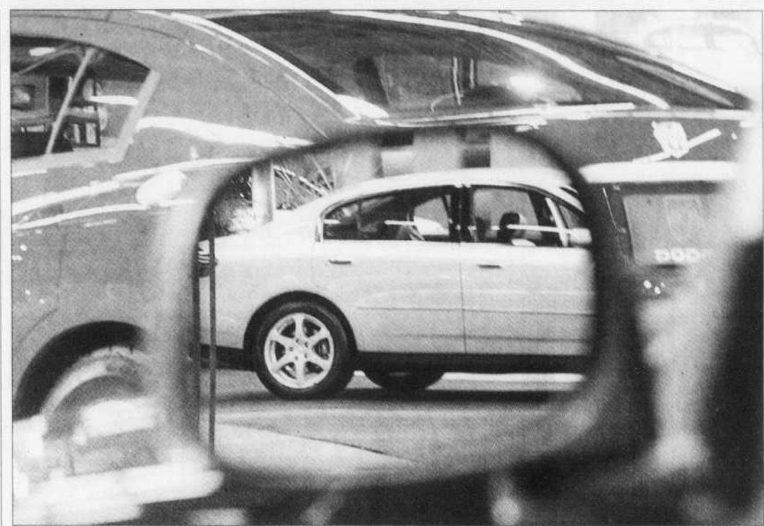
Les ventes du secteur de l'automobile ont affiché un gain de 2,1 % en octobre.