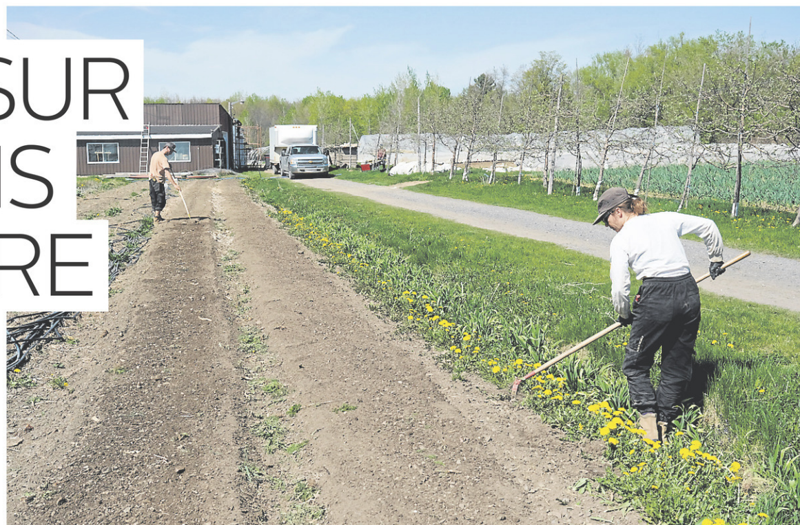
Les Jardins de la Terre à Saint-Paul-d'Abbotsford

Les Jardins de la terre, organisme qui existe depuis 2004, accueillent une vingtaine de participants chaque année, de mi-février à fin décembre.