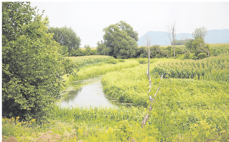
L'étude des bandes riveraines continue dans la MRC de Rouville.

L'étude des bandes riveraines continue dans la MRC de Rouville. À partir de cette semaine, deux agents en environnement du territoire évalueront l'état et l'évolution de ces milieux naturels, poursuivant le travail entamé l'été dernier.