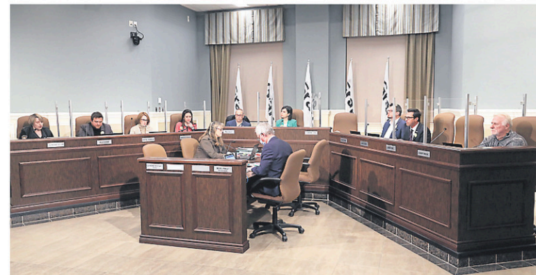
Des élèves du secondaire pourront vivre comme un élu municipal le temps d'une journée.

Des élèves du secondaire pourront vivre comme un élu municipal le temps d'une journée. La Ville de Granby revient avec le « Conseil municipal d'un jour » qui permettra aux adultes en devenir d'en connaître plus sur la démocratie municipale.