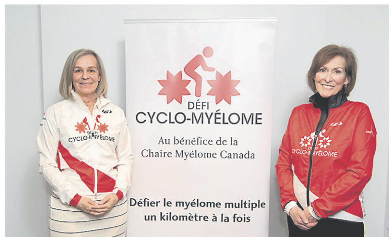
Les fondatrices du défi se donnent pour mission de faire connaître le myélome et amasser des fonds permettant la recherche de traitements et de remèdes.