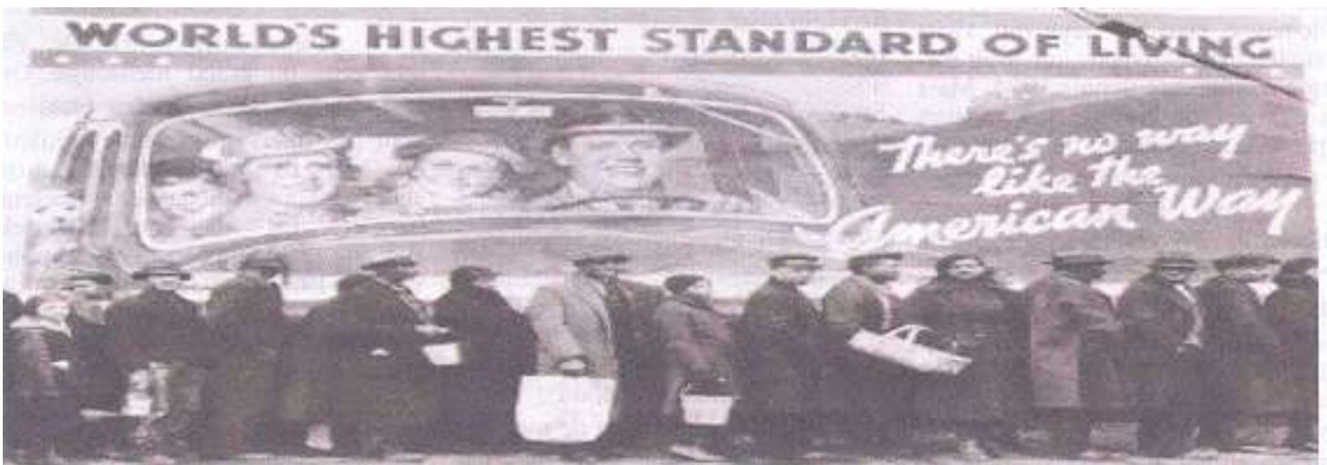
LE PLUS HAUT STANDARD DE VIE AU MONDE = LES PAUVRES ENRICHISSENT LES RICHES

Donc il y a des chances que, annoncée par toute une série de crise cycliques et/ou périphérique (hors du « centre »), cette crise-ci soit d'une ampleur comme on n'en a jamais vu. Si les mécanismes de formation de la crise sont les mêmes qu'autrefois, la crise d'aujourd'hui est plus grave que la crise des années 1930 qui était elle-même plus grave que celle de 1873. Cela ressemble donc aux précédentes, c'est plus grave que les précédentes et cela donne la parole au peuple pour trouver la solution la plus rapide compte tenu de ce qui risque de se passer.