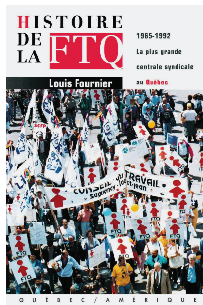
Le deuxième tome de l'Histoire de la FTQ a été publié en 1994 aux Éditions Québec-Amérique.