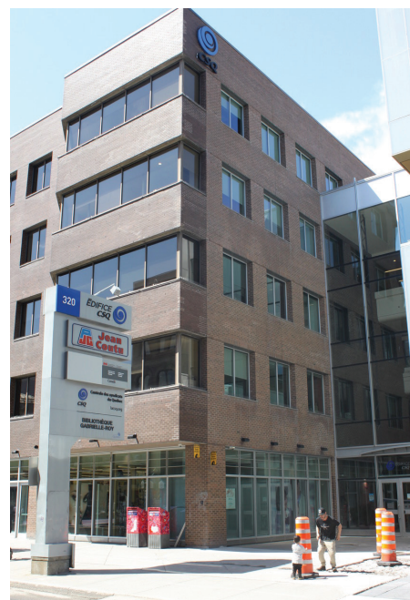
L'édifice actuel de la CSQ dans la basse ville de Québec. Un déménagement dans un autre édifice est prévu pour la fin de l'année 2025.

Pour les livres plus anciens, ils sont numérisés s'ils n'existent pas en version numérique. Il y a toujours une copie de préservation physique pour prouver que le livre a été acheté. Pour la reproduction, il y a un montant annuel alloué à