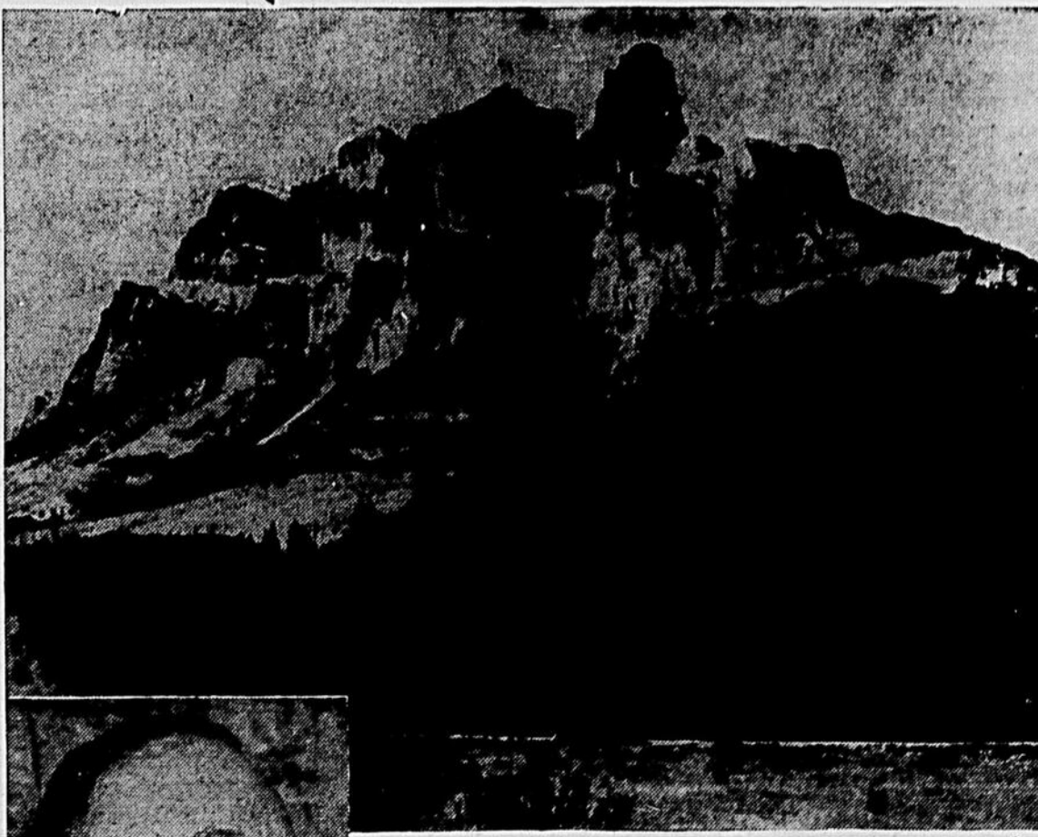
LE MONT EISENHOWER DANS LES ROCHEUSES: Voulant honorer d'une manière permanente le général Dwight D. Eisenhower, qui a conduit les armées alliées à la victoire, en Europe, l'hon. Mackenzie King a annoncé, ces jours derniers, à Ottawa, au lunch du Canadian Club, auquel assistait le grand chef américain, que le mont Castle, situé près de la voie du Pacifique Canadien, dans les Rocheuses, entre Banff et Lac Louise, s'appellerait désormais le "mont Eisenhower". Ce pic rocaillieux, qui dresse sa cime déchiquetée à 9,380 pieds au-dessus du niveau de la mer, est une des curiosités pittoresques de la région. Le nom de Castle lui avait été donné par les premiers explorateurs à cause de sa forme qui rappelle celle d'un château-fort du moyen âge.