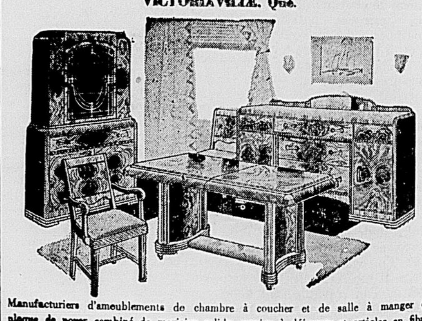
Manufacturiers d'ameublements de chambre à coucher et de salle à manger en plaque de noyer combiné de merisier solide, service à déjeuner et articles en fibre.