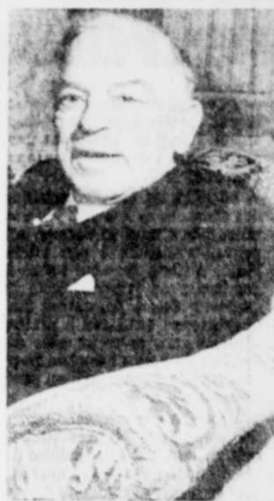
Le double mandat de Mackenzie King, qui a été premier ministre du Canada pendant 22 ans, s'est étalé de 1921 à 1930, puis de 1935 à 1948.

Si King était encore de ce monde, il serait sans doute le premier à vouloir regarder cette production grandiose à sa mesure.