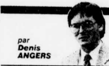
par Denis ANGERS

Il y a une trentaine d'années, dans les années les plus sibiériennes de la guerre froide, les analystes de la scène internationale recouraient systématiquement à une théorie dite des dominos et l'appliquaient sans grand discernement à l'expansionnisme communiste.