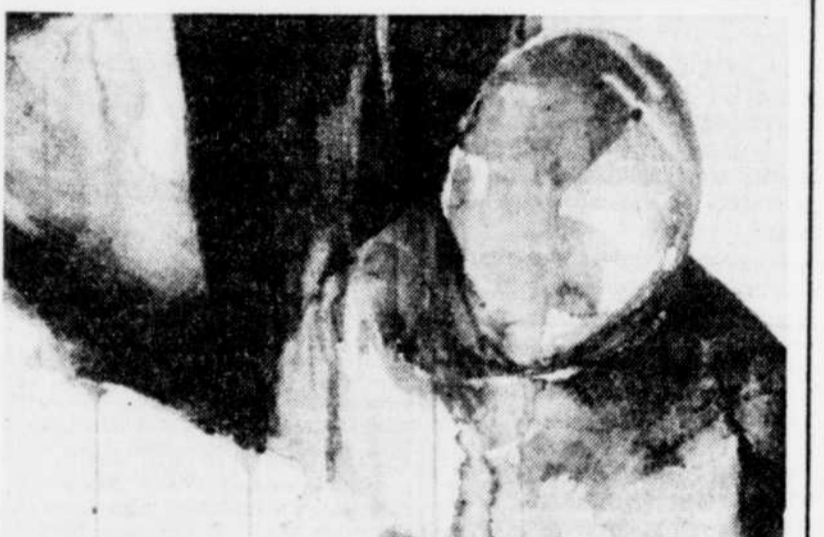
«L'ange-déchu», une oeuvre de Jean Devost, que l'on peut voir à la Maison La Laurière, 410 avenue Laurier.

LES LUNDIS DE L'IMPRO-THÉÂTRE. Ce soir 21h. L'équipe d'improvisation du Bar l'A-Propos reçoit l'équipe du Cégep de Limoilou.