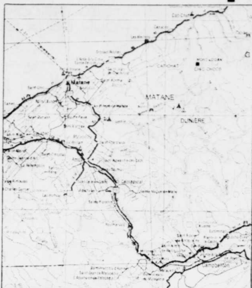
Les 3.000 habitants de la région de Matapédia, à la tête de la baie des Chaleurs, à l'ouest de Pointe-à-la-Croix, veulent profiter de l'exemption fiscale, même s'ils vivent à moins de 160 kilomètres de Matane.

Tour à tour, des représentants des six municipalités, soutenus par quelque 325 des leurs, réunis à Matapédia, ont remis au député fédé-