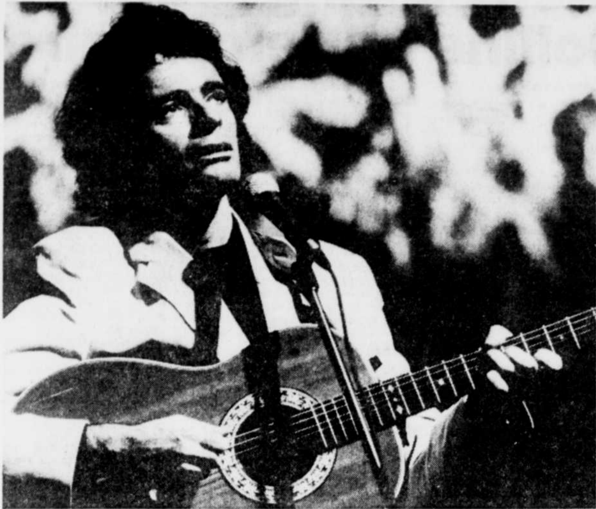
Quand Nicolas Peyrac chantait avec sa seule guitare, la magie reprenait ses droits.

Le chanteur s'annonçant aphone dès la première chanson, on pouvait aussi s'attendre à une soirée tranquille et brève, mais la rencontre devait évoluer vers une communication très chaude, très intime, comme on pouvait le vérifier au fil des nombreux rappels.