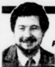
par Raymond GIROUX

Il y avait exactement un an, hier, que l'impensable se produisait. Après quelques alertes nucléaires aux retombées contrôlées comme à Three Miles Island, l'énergie a eu raison de son manipulateur. Les Ukrainiens souffriront pendant des générations de l'accident de la centrale de Tchernobyl malgré les propos lénifiants des médias soviétiques et les bienfaits que le monde scientifique découvre, semble-t-il, dans cet événement.