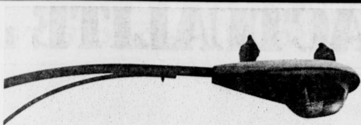
Depuis le mois de juin 1986 que Saint-Jean-Chrysostome, une ville de 10,200 habitants, a adressé une demande à Hydro pour prolonger l'éclairage dans diverses rues.

Selon le chef du PMB, l'état des finances indique clairement la nécessité de moins dépenser et de limiter au maximum les règlements d'emprunt. ♦