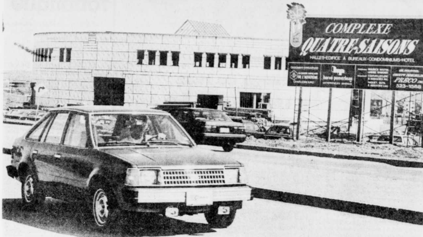
Le complexe Quatre-Saisons, à Charlesbourg, est en chantier depuis quelques semaines. Les automobilistes peuvent voir les édifices en construction en bordure de l'autoroute Laurentienne.