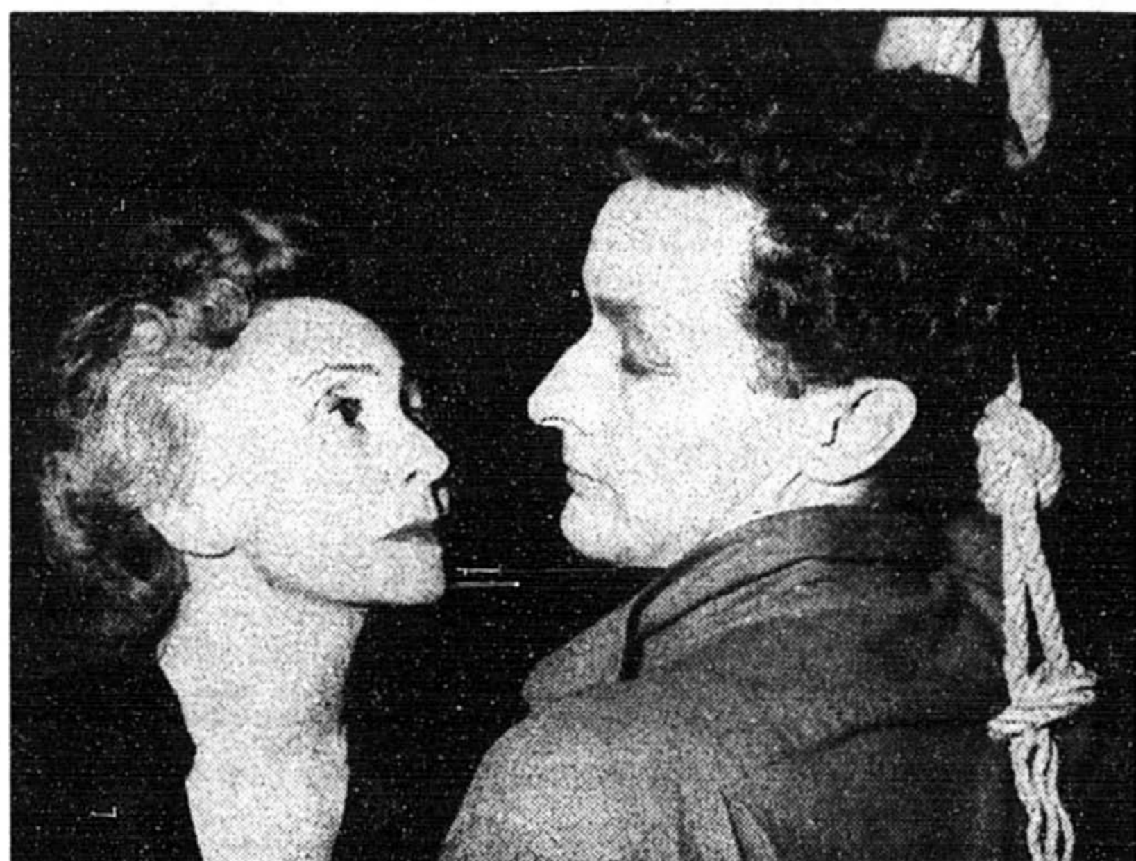
Madeleine Renaud avec Jean-Louis Barrault, dans une scène de L'Échange de Claudel .

vacité, quoique nonagénaire. Quiconque croisait Madeleine Renaud dans l'enceinte du Théâtre du Rond-Point était émerveillé par sa jeunesse d'esprit et par sa simplicité. C'était assurément une grande dame du théâtre.