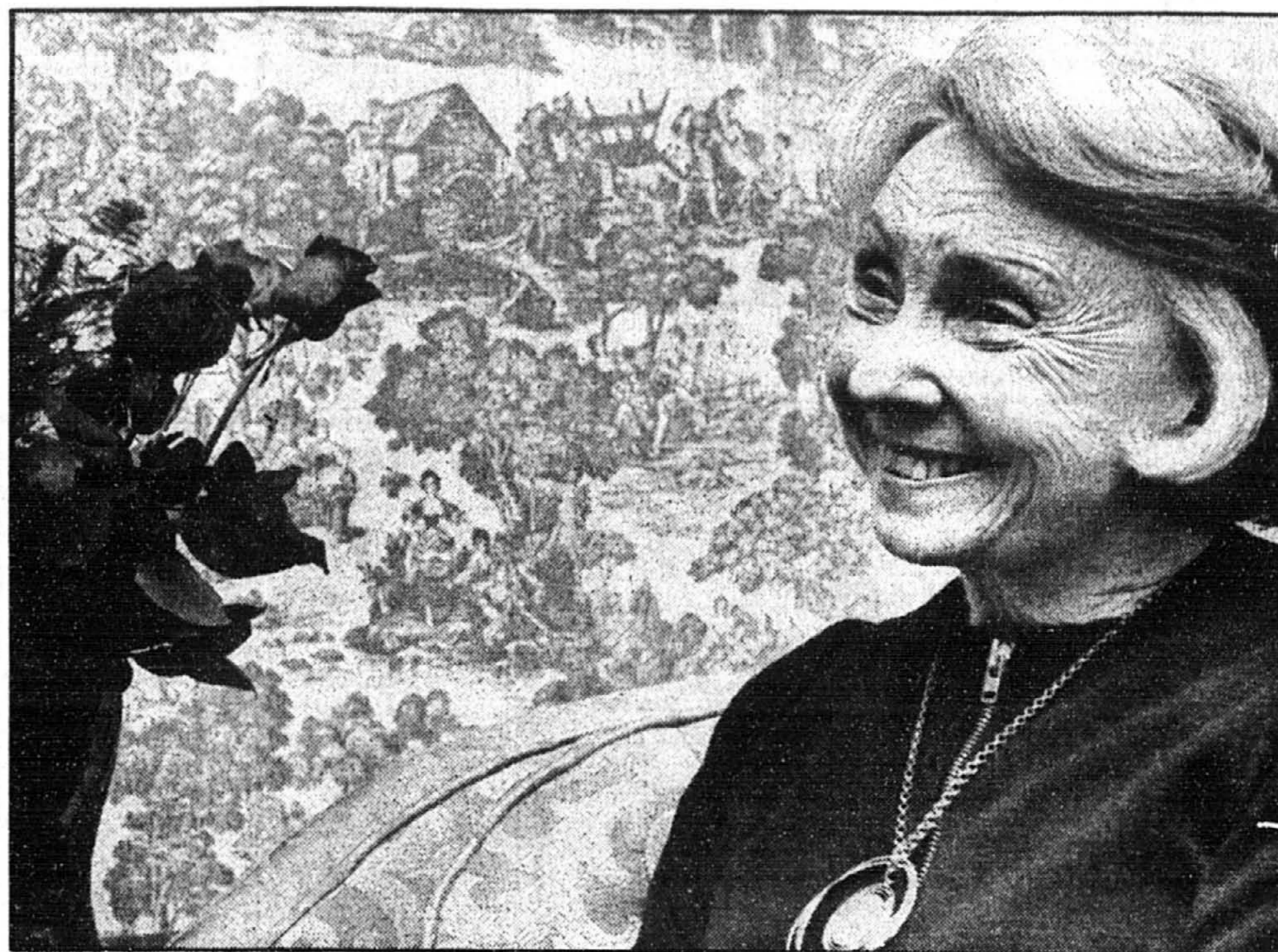
Madeleine Renaud, lors de l'un des nombreux passages de la comédienne française au Québec, depuis le tournage du Maria Chapdelaine de Julien Duvivier, en 1934.