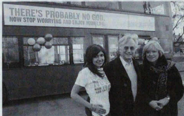
La première campagne de pub athée sur les bus de Londres a reçu de nombreux appuis. On reconnaît sur la photo Richard Dawkins, le célèbre biologiste et auteur du livre The God Delusion .

Nous, humanistes du Québec, sommes arrivés à deux conclusions complémentaires : non seulement les religions ne disposent d'aucune base factuelle fiable pour soutenir leurs assertions quand au surnaturel, mais, de plus, la croyance très ancrée dans les effets bénéfiques des croyances religieuses, sur le plan social et par rapport à l'athéisme, ne peut plus être raisonnablement défendue, à tout le moins en ce qui concerne les pays développés et à notre époque. En conséquence, nous nous devons de faire comprendre à la population que l'athéisme en lui-même ne représente aucunement une menace pour la cohésion et l'harmonie des sociétés et que, bien au contraire, la libre pensée et l'humanisme athée sont aussi des atouts pour l'épanouissement des peuples, tout comme la liberté de conscience et la liberté d'expression.