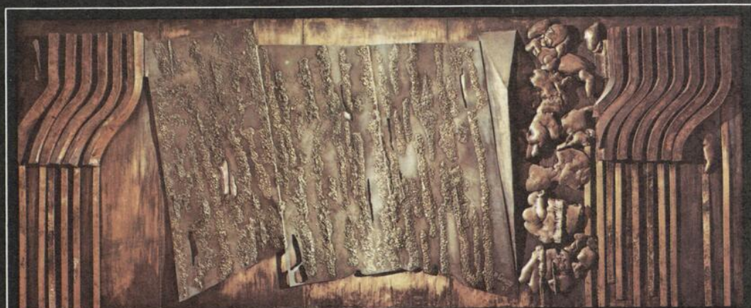
Murale de bronze de Peter Gnass

Théâtre Port-Royal du 13 mai au 12 juin 1976