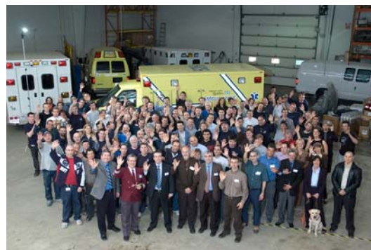
Les employés de Demers Ambulances, tous réunis pour célébrer cet événement spécial