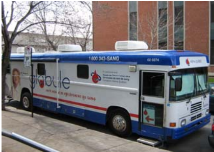
L'unité mobile d'Héma-Québec, Globule, devant le centre administratif d'Urgences-santé

Le mercredi 2 mai dernier avait lieu la collecte de sang d'Héma-Québec au centre administratif d'Urgences-santé. Un gros merci à tous les donateurs : 43 employés se sont inscrits pour un don de sang au cours de cette collecte. La journée même avait aussi lieu la collecte de sang de l'arrondissement de Saint-Léonard : 241 donateurs ont été accueillis, un nombre inespéré selon la responsable des communications d'Héma-Québec. La participation d'Urgences-santé à cet événement a d'ailleurs été très appréciée.