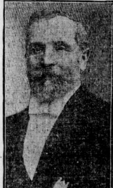
L'ex-président Loubet, que des dynamitards ont tenté ce matin de faire sauter avec toute sa famille.

Paris, 24.—On mande de Montelmar, département de la Drôme, au "Journal", que ce matin même, les autorités ont fait la découverte d'une bombe, à laquelle était attachée une mèche