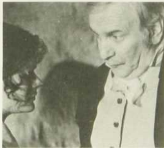
Quelques arpents de neige

En plaçant son sujet dans le cadre de l'insurrection de 1837, Denis Héroux s'est montré assez ambitieux dans sa volonté de donner un souffle épique au cinéma québécois. Il a réussi en nous donnant un long métrage de qualité où se côtoient la violence de l'époque et le romantisme de nos deux héros. Il faut signaler les très belles images de Bernard Chentrier et la musique de François Cousineau.