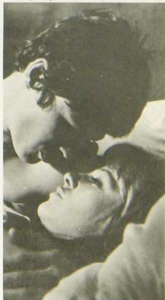
La Leçon particulière

Michel Boisrond fait ici montre de justesse et de délicatesse. Malgré des attitudes plutôt libertines de part et d'autre, le film traduit les sentiments réels qui président à la maturation de l'adolescent. La Leçon particulière , une autre version de l'éternel triangle.