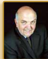
Le directeur général,