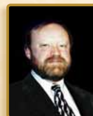
Le président du conseil d'administration,