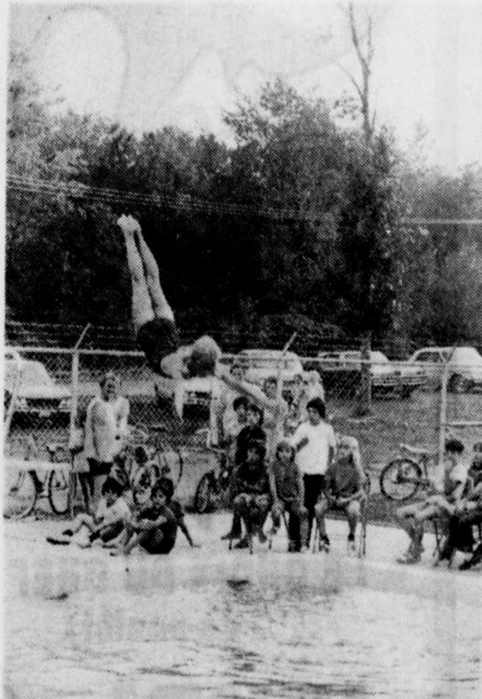
Pour clôturer la saison d'activités de l'OTJ de Lennoxville les moniteurs et monitrices ont préparé un spectacle aquatique composé de plongeurs et de nages rythmées. Cette activité s'est déroulée hier soir à la piscine municipale de Lennoxville. Quatre plongeurs ont démontré leur savoir faire et 20 nageurs ont présenté différents numéros de ballet aquatique. Sur cette photo, on voit une jeune fille exécuter le plongeon du cygne.