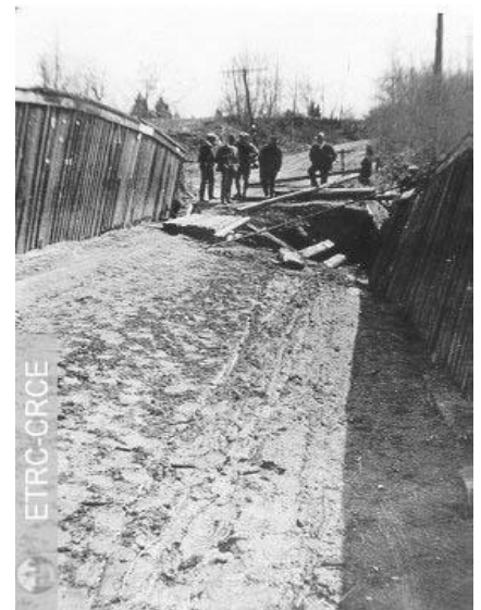
Inondation à Burrough's Falls, dans les Cantons de l'Est