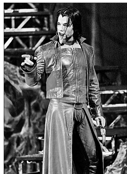
Bruno Pelletier lors de la première de Dracula au Théâtre St-Denis, le 1 er février 2006.