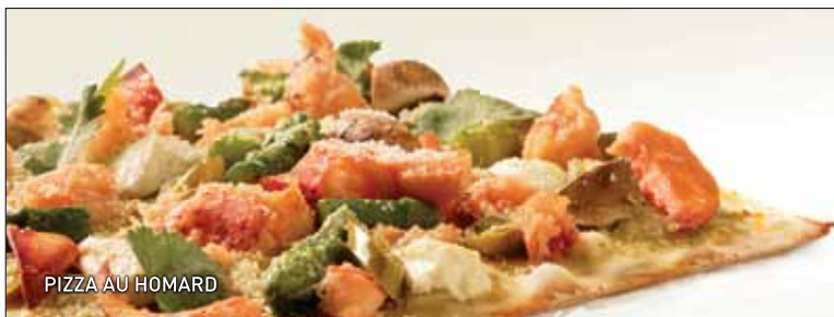
PIZZA AU HOMARD

DÈS LE 7 MAI SAVOUREZ LES CRÉATIONS ESTIVALES DE LA PIAZZETTA