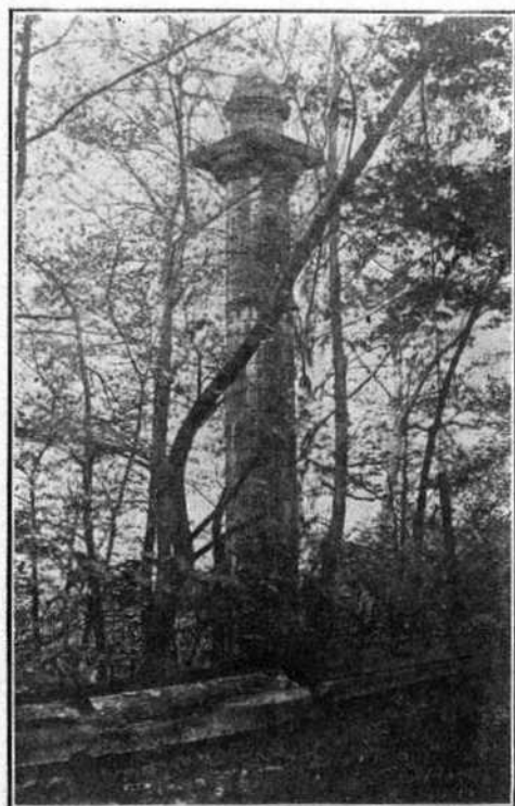
Colonne McTavish à Montréal

Mes jeunes amis, ne vous sentez-vous pas, cet après-midi, d'excellents explorateurs? Devant cette colonne McTavish dont il a fallu disputer la vue à l'ombre chantante des arbres, aux eaux paisibles du réservoir municipal, et même à une clôture sévère, il faut avouer que tout en ce bon Montréal, n'est pas accessible, en effet, à des écoliers et à des écolières en veine d'études historiques.