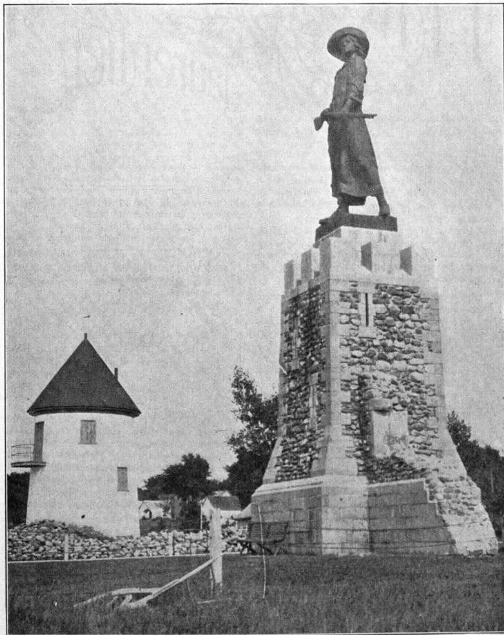
Monument de Madeleine de Verchères, à Verchères