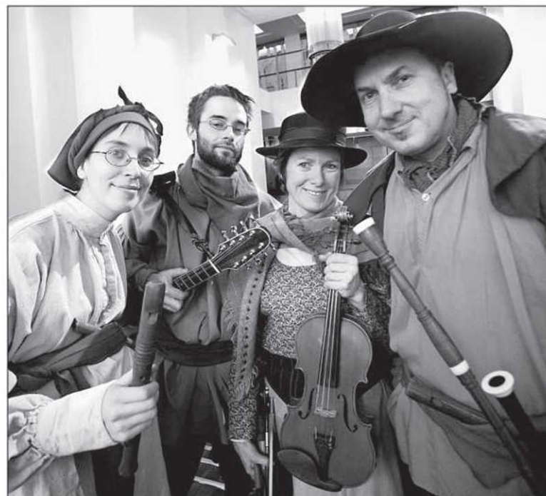
Le spectacle Le Chant des passeurs de l'ensemble Strada mêle les chants médiévaux, les incantations des Amériques, les chansons traditionnelles et les danses. Cet événement officiel du 400 e réunira quatre chanteuses et six instrumentistes du Québec, de France et du Nunavut sur la scène du Palais Montcalm, le 30 avril.

Information : palaismontcalm.ca Billetterie : 418 641-6040