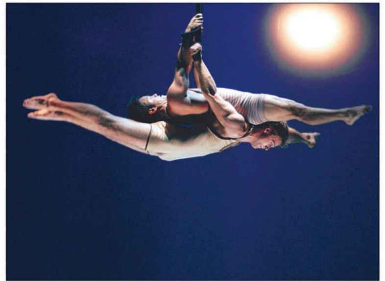
Nebbia comporte quelques séquences d'un cirque plus classique, avec contorsionnistes, acrobates, jongleurs : des numéros toujours élégants et poétiques, mais plus attendus.

Après Genève, il y aura la Slovénie, puis 35 représentations en Italie, puis l'Australie, la Corée et la Colombie. La routine en quelque sorte pour ce petit groupe de funambules surgis des Îles-de-la-Madeleine et qui, tout en restant dans les dimensions de l'artisanat, font maintenant le tour de la terre à longueur d'année. Sans oublier de s'arrêter à Montréal, où jusqu'à présent, avaient lieu leurs créations mondiales. La création de Nebbia s'est faite à Genève, mais le spectacle ouvrira également la saison du TNM, le 9 septembre.