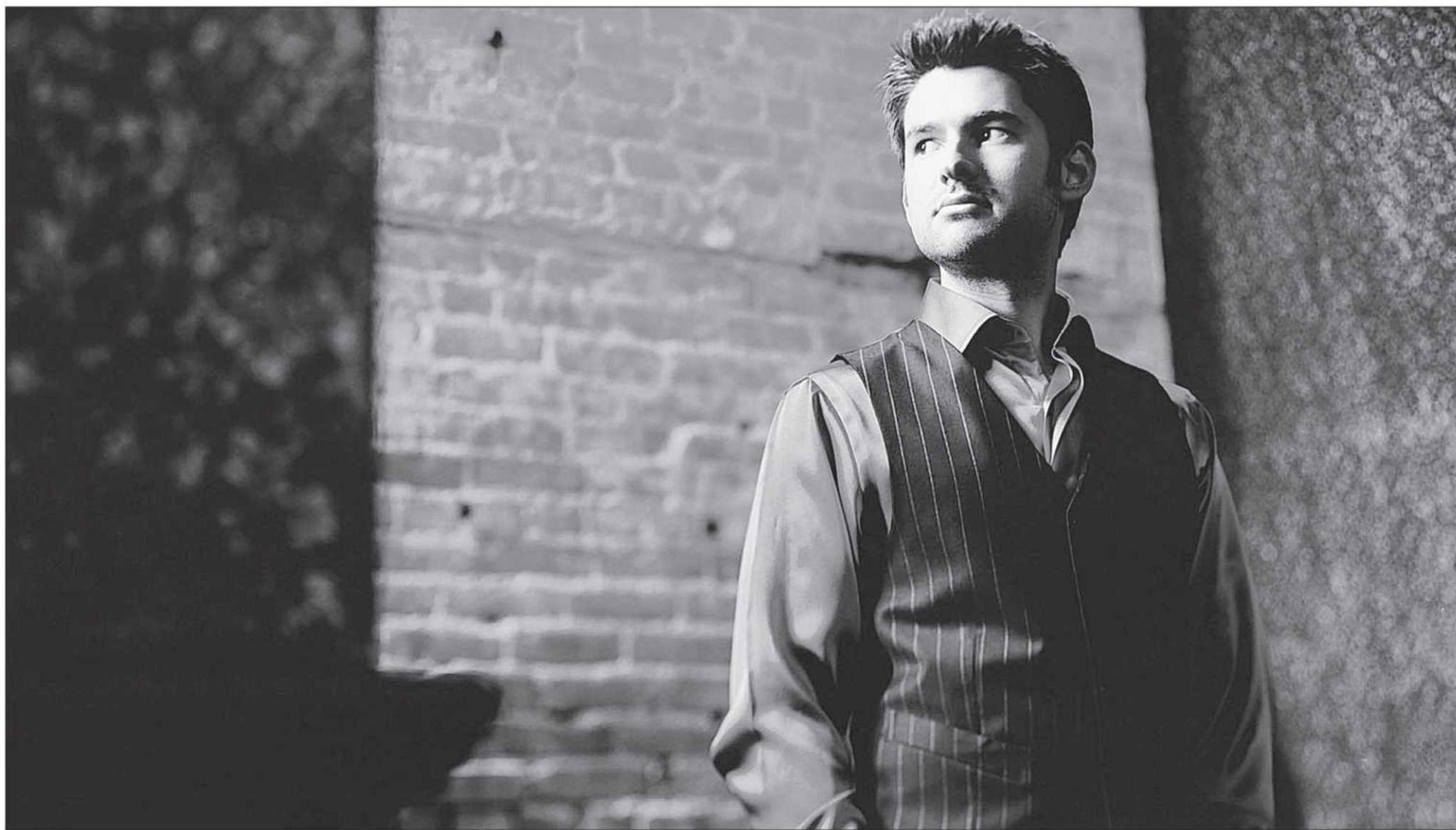
Matt Dusk s'apprête à sortir de son cocon de standards : il aimerait beaucoup fusionner la musique jazz à la musique pop.