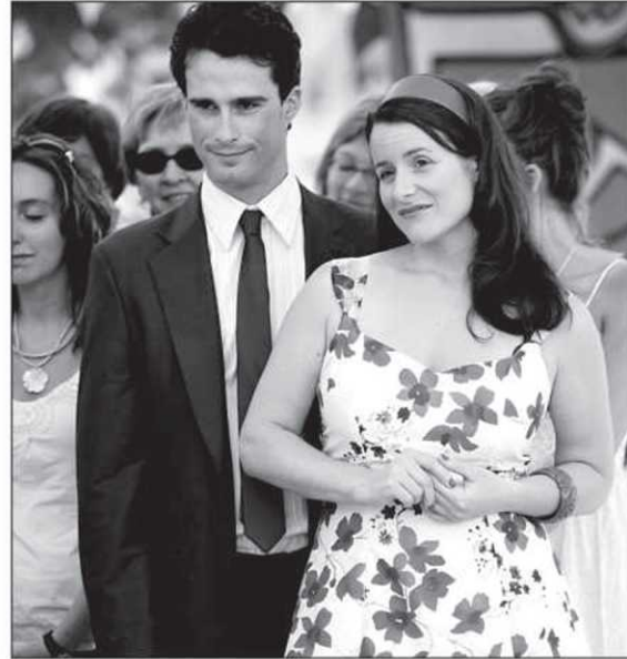
Providence, qui ne s'essouffle pas, a connu un automne avec ses 910 000 fidèles, sa meilleure performance à ce jour.