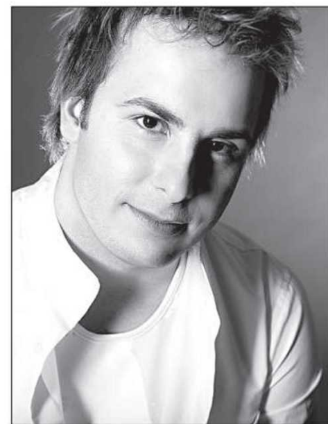
Yannick Nézet-Séguin