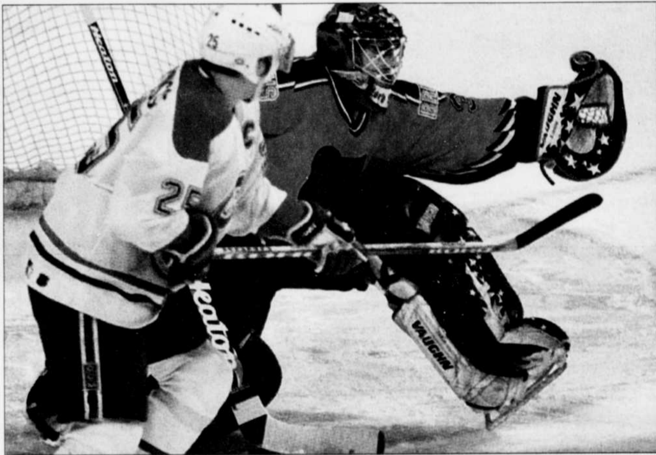
Le gardien des Bruins, Byron DaFoe, a brillé en faisant l'arrêt sur ce tir de Vincent Damphousse, en première période, hier.