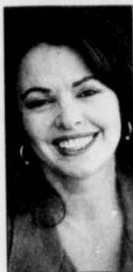
La comédienne Louise Portal est la présidente d'honneur du festival.

Les cinéphiles avertis sont conviés tout au long du festival à se rencontrer au Café Cinoche, là où les discussions sur les films présentés ont