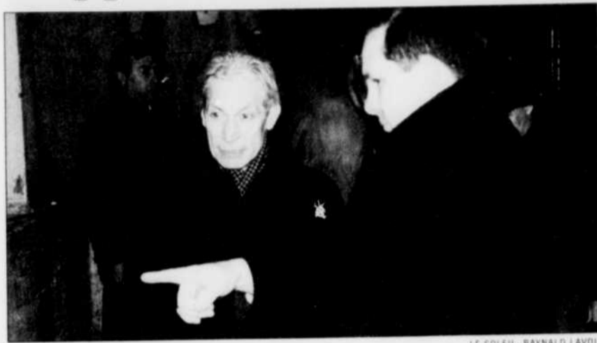
Charlie Watts est sorti le premier, manteau bien coupé, souriant.

choristes dans le hall allait rapidement confirmer la rumeur: trois des plus célèbres musiciens de la planète s'apprétaient à quitter la ville une fois pour toutes. Le départ en trombe de la Mercedes allait déclencher un chassé-croisé rigolo. Par où allaient-ils donc sortir? Par le stationnement intérieur de l'hôtel ou la porte de l'entrepôt? Un petit jogging autour du site le plus venteux de Québec ne fait de mal à personne. Pendant une trentaine de minutes, trois photo-