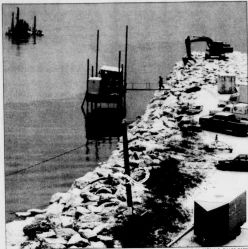
COLLABORATION SPÉCIALE, GILLES GAGNE