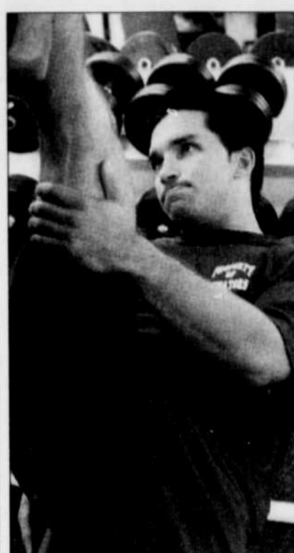
Alexandre Daigle représente un gros problème pour les Sénateurs d'Ottawa, qui devront payer pour l'échanger.