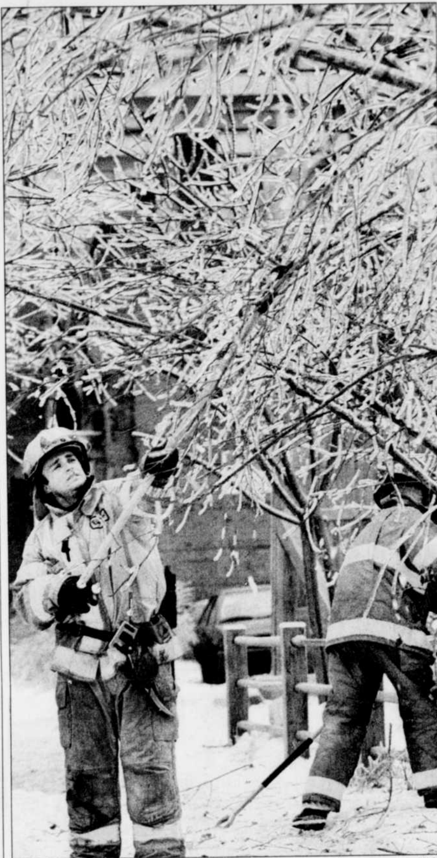
Deux pompiers de Montréal en pleine opération d'élagage, hier. Pour accélérer les choses, Hydro-Québec a fait appel à des équipes d'élagueurs des États-Unis.