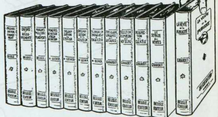
RELIURE BLEUE — TITRES DORES

Pour le propriétaire, le gérant ou les chefs de services