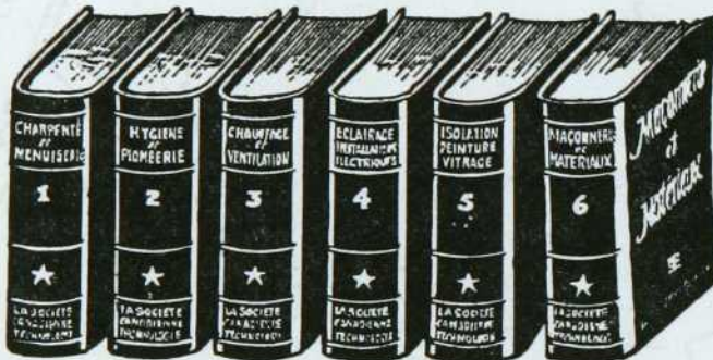
RELIURE ROUGE MANDARIN