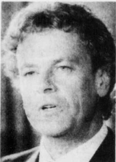
«Si la délégation québécoise n'est pas importante numériquement parlant, elle a une importance symbolique», estime le député néo-démocrate Lorne Nystrom.

«Il vaut mieux laisser passer le temps, et laisser les néo-démocrates fédéraux se rendre compte qu'ils se sont enfermés dans un cul-de-sac historiques», a-t-il conclu.