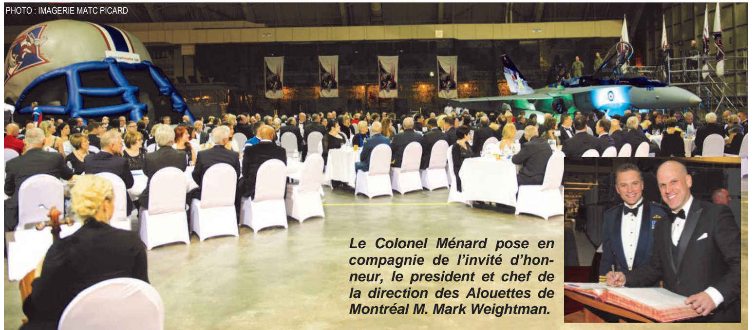
Les organisateurs avaient transformé le hangar 6 en salle de réception chaleureuse au couleurs de Alouettes.

La section de l'alimentation de la BFC Bagotville a préparé un buffet gastronomique incluant des mets succulents inspirés des saveurs de la région. La présentation de la nourriture respectait le décor de la soirée avec une nappe décoratrice simulant un terrain de football, incluant les arches de buts à