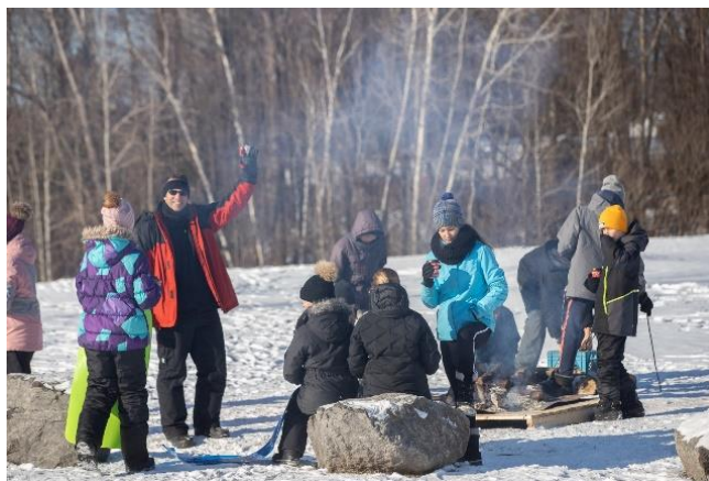
Carnaval | Feu de camp, guimauve et chocolat chaud

Au retour du congé de la relâche scolaire, notre monde a basculé. La pandémie a forcé la fermeture de l'école. Du jamais vu : l'école devrait se faire à la maison. Pour des jeunes de 12 et 13 ans, c'est terriblement difficile! De plus, il faut accepter l'annulation de toutes les activités prévues, tel le théâtre culturel pour lequel plusieurs élèves répétaient depuis déjà longtemps! Quelle fierté de voir les enseignants et les enseignantes mettre la main à la pâte, modifier complètement leurs cours pour les adapter à notre nouvelle réalité, préparer des exercices, vidéos et rencontres en ligne. La palme d'or revient cependant aux élèves qui en sont pourtant encore à s'adapter au secondaire. Efforts et persévérance étaient au rendez-vous jusqu'à la fin. Bravo!