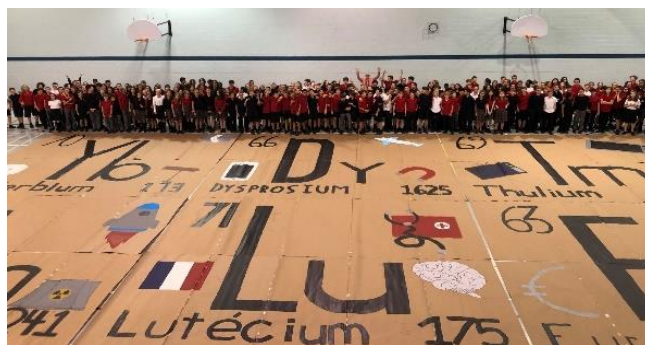
Participation à la construction du plus grand tableau périodique fait de matière recyclée au monde

Au retour du congé de la relâche scolaire, c'est la calamité. La COVID-19 a forcé la fermeture de l'école, le confinement et l'apprentissage à distance. Motivation et organisation sont devenues les clés de la réussite. Par contre, comme le dit le vieux proverbe français : De la nécessité naissent les talents . Tous se sont mis au travail. Les enseignants et les enseignantes ont adapté leurs cours; ont préparé des exercices, des évaluations en ligne et des vidéos explicatives; ont organisé des rencontres en ligne. Les élèves ont triplé leurs efforts et, avec persévérance, ont mis près de 15 heures par semaine à terminer leur année scolaire à la maison. Nous tous au Collège sommes très fiers du travail de nos enseignants et de nos élèves. Chapeau!