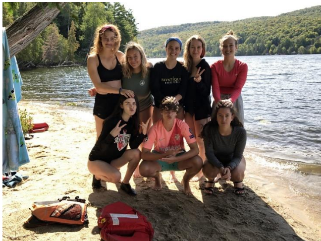
Journée Saint-Alexandre | Parc de la Gatineau

Malgré les événements qui ont forcé la fermeture de l'école en mars, plusieurs activités à caractère social et culturel auront tout de même permis d'agrémenter la 4 e secondaire. En début d'année, il y a eu la Journée Saint-Alexandre dans le parc de la Gatineau. Les participants ont pu se côtoyer en matinée lors d'une randonnée pédestre ou d'une randonnée en canot sur le lac Meech, le tout suivi d'un pique-nique et d'un bel après-midi où diverses activités ludiques étaient au menu.