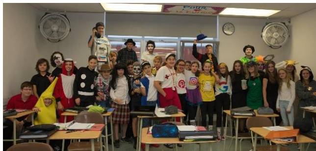
Activité de l'Halloween

Tout comme les années précédentes, le conseil des élèves est élu à la mi-octobre et a commencé rapidement à se mettre à la tâche avec la décoration du corridor pour l'Halloween. En plus de débiter l'apprentissage du fonctionnement en comité, les membres ont donné un bon coup de main lors de l'organisation des activités. Le 20 décembre, sous une belle journée un peu froide, notre fête de Noël s'est déroulée à l'extérieur avec glissade, hockey, volleyball sur neige et feu de camp avec guimauves et chocolat chaud. Après les Fêtes, les élèves nous sont revenues en pleine forme. Dès la première semaine de février, le Carnaval, sous une forme améliorée qui met l'accent sur les activités extérieures et intérieures, est venu mettre un regain de vie dans l'école. Puis le 19 février, lors d'une autre splendide journée hivernale, a eu lieu notre Journée d'hiver. Le taux de participation de nos élèves dépasse les 80%. Tout va bien.