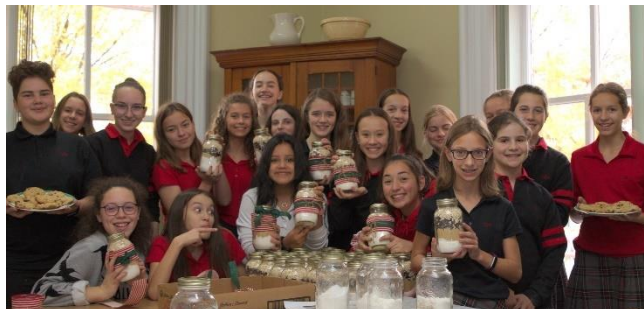
Pots de biscuits

De plus, plusieurs élèves se sont engagés dans diverses activités récurrentes telles que la brigade de la rentrée, la confection de pots de biscuits pour la Maison Alonzo-Wright, les paniers de Noël, les midis construction, le CDF, le camp de l'animation sociale, pour ne nommer que ces exemples.