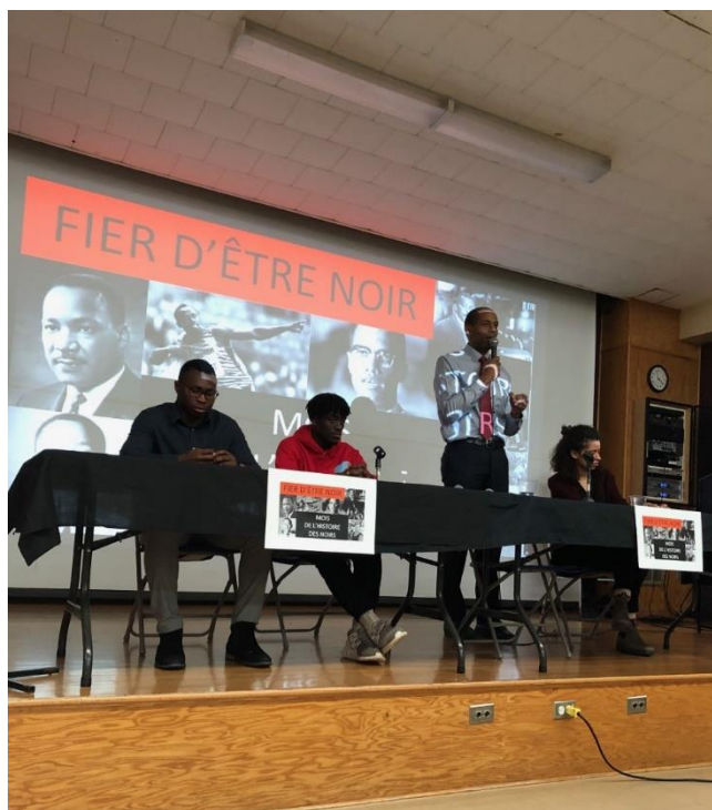
Conférence Fier d'être noir

intitulée Fier d'être noir à laquelle ont assisté tous les élèves de la 4 e secondaire. Quatre invités, dont le député fédéral de la circonscription Hull-Aylmer, monsieur Greg Fergus, sont venus témoigner de leur expérience en lien avec le racisme dont ils ont été victimes à un moment de leur vie et du chemin qu'ils ont parcouru.