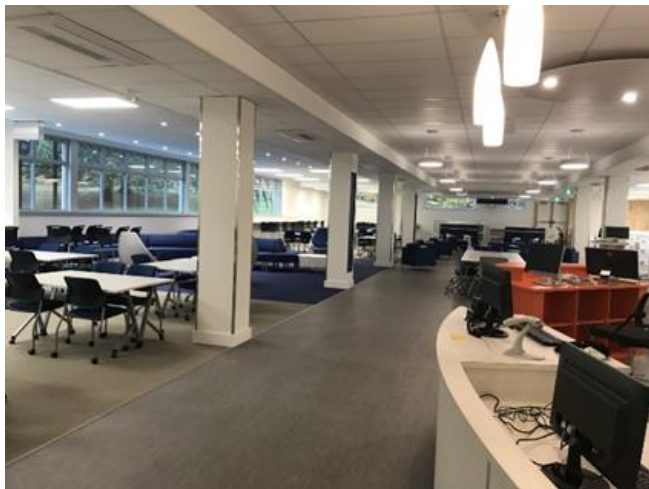
Nouvelle bibliothèque Pierre-Sanscartier

La bibliothèque a rouvert le lundi 18 novembre 2019 à 11 h 35. Les élèves y sont venus par dizaines. Ils ont été impressionnés par le très grand changement de décoration et les nouveaux meubles. Toutefois, la section des bandes dessinées n'était pas encore prête. Ils ont dû patienter jusqu'au jeudi 30 janvier 2020 pour s'installer confortablement dans cet espace relaxant.