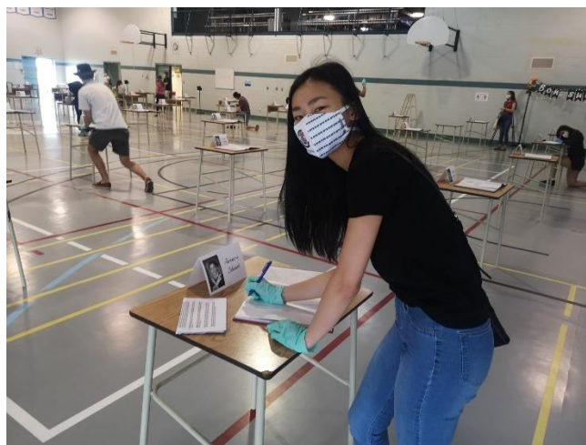
Signature des albums des finissants et des finissantes

Les finissantes et les finissants ont eu l'occasion de signer les albums des finissants les 22, 23 et 25 juin. L'activité avait été proposée dans le cadre des consultations des comités d'élèves (comité du bal, comité de l'album et conseil des élèves).