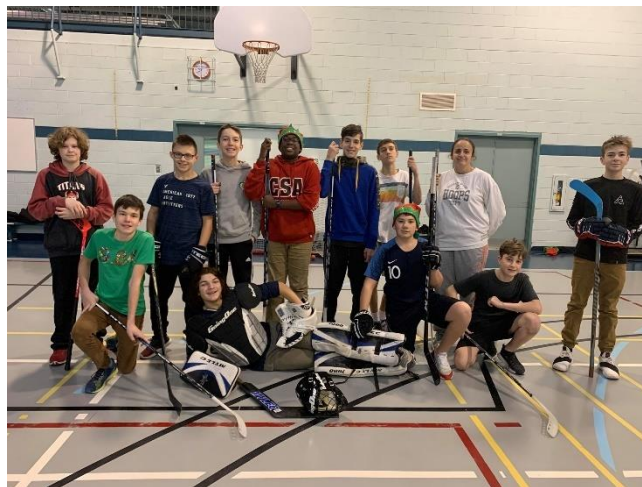
Activité de Noël

En février, les activités de tout genre organisées dans le cadre de la semaine du Carnaval auront agrémenté de façon particulière l'heure du dîner des élèves. Cette semaine du Carnaval fut suivie, quelques jours plus tard, par la Journée d'hiver tenue dans des conditions idéales.