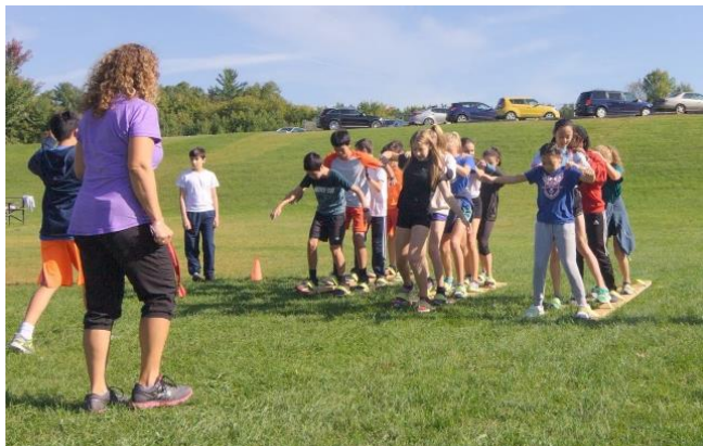
Journée Saint-Alexandre | Activités au Collège

Cette année a encore une fois été remplie de belles activités, telle la Journée Saint-Alexandre où, lors d'une magnifique journée ensoleillée, les élèves ont pu fraterniser entre eux, découvrir l'école et son histoire lors du classique rallye ainsi que côtoyer leurs enseignants dans un contexte fort amusant et bien différent de celui d'une salle de classe. Cette année, nous avons opté pour une formule légèrement différente, avec quelques nouvelles activités qui ont été très appréciées, comme le dessin libre avec craies de trottoir sur le terrain de crosse, le défi évasion et la course à obstacles à relais. Assurément à répéter l'an prochain. Se sont succédé ensuite très rapidement notre traditionnelle soirée des Flos de même qu'une activité spéciale, Debout pour la planète , qui a repoussé de quelques jours notre classique Journée cross-country.