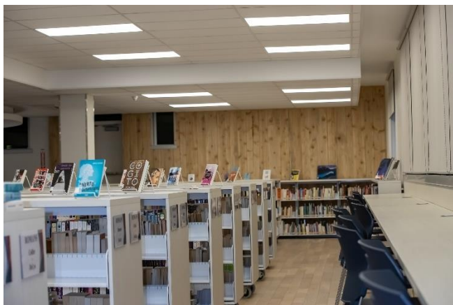
Nouvelle bibliothèque Pierre-Sanscartier

Un 5 à 7 a été organisé le 30 janvier 2020 par la Fondation Collège Saint-Alexandre pour procéder à l'ouverture officielle de la bibliothèque Pierre-Sanscartier. Une animation marquée par le témoignage de différentes personnes concernant le nouvel aménagement de la bibliothèque. Plusieurs donateurs étaient présents pour voir le résultat final.