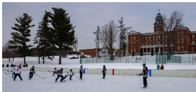
Match de hockey | Patinoire du centenaire

Du côté des activités parascolaires des Titans, le Collège Saint-Alexandre a inscrit plus de 500 élèves dans 41 équipes aux activités du RSEQ en basketball (6), football (2), futsal (9), hockey sans mise en échec (3), et volleyball (10), en plus des 43 élèves qui ont participé à la ligue de badminton et les 36 participants en cross-country régional.