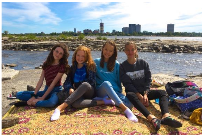
Journée Saint-Alexandre | Parc Moussette

Après des vacances d'été bien méritées pour tous, nous avons accueilli chaleureusement les élèves pour lancer l'année scolaire. Retrouvailles, quelques nouveaux visages, plusieurs histoires à raconter, l'accueil s'est déroulé dans la joie et l'excitation de la nouveauté. En tout début d'année, deux activités ont permis de faire connaissance. Le jeudi 5 septembre, une rencontre en soirée a été l'occasion pour les parents de voir le fonctionnement du degré et d'échanger avec les enseignants et les enseignantes. Une semaine plus tard a eu lieu la traditionnelle sortie au parc Moussette dans le cadre de la Journée Saint-Alexandre, qui permet aux enseignants et aux élèves de se côtoyer agréablement dans une atmosphère détendue de plein air. Le temps était splendide. Que ce soit en randonnée à bicyclette, en patin à roues alignées, ou encore pour jouer au tennis, au volleyball, au soccer, au basketball, au baseball ou tout simplement pour se promener et jaser, ce fut une journée très agréable.