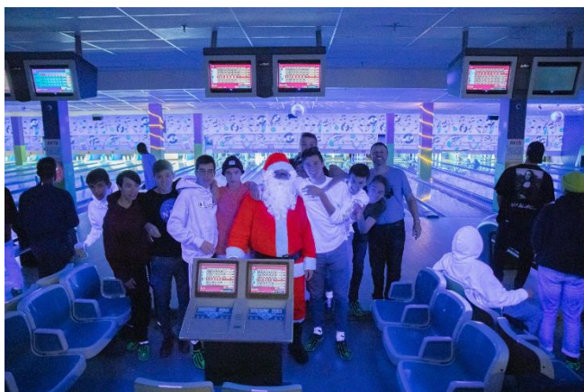
Activité de Noël | Salle de quilles Anik

Le 20 décembre tout le degré s'est retrouvé à la salle de quilles Anik pour célébrer le début des vacances de Noël. Le tournoi de quilles et le dîner préparé par le comité de degré ont été la prémisse du congé des fêtes.