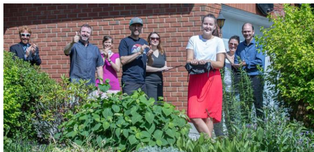
Livraison des albums des finissants et des finissantes

Le 29 juin 2020, des membres du personnel ont livré les albums des finissants au domicile des finissantes et des finissants.