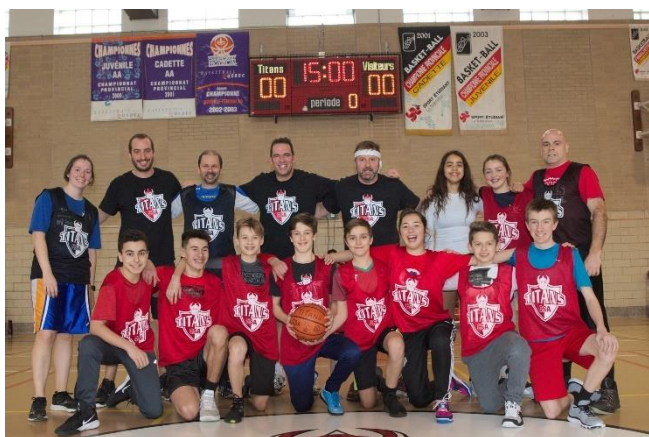
Match de basketball | Élèves vs Personnel du CSA

Durant les heures de dîner, les gymnases ont été mis à la disposition des élèves désirant pratiquer des activités libres comme le basketball, le futsal et le volleyball. Ces périodes libres ont été ponctuées de tournois interclasses ou de ligues sportives. Les ligues intra-muros de hockey-balle, hockey sur glace ainsi que basketball au deuxième cycle ont d'ailleurs été un franc succès. Chacune s'est conclue par un match entre le champion de la ligue et une équipe composée de membre du personnel du Collège. Encore une fois cette année, la salle d'entraînement a pu ouvrir ses portes aux élèves du 2 e cycle et ce, six jours par neuvaine. C'est sans oublier les B.class offertes aux filles à tous les vendredis. Il y a eu le retour du match de hockey sur glace entre notre équipe de hockey sur glace juvénile D3 et une équipe des membres du personnel CSA, à l'aréna Beaudry. Ce match fut joué en après-midi, permettant ainsi à tous les élèves de la 5 e secondaire d'être libérés pour y assister.