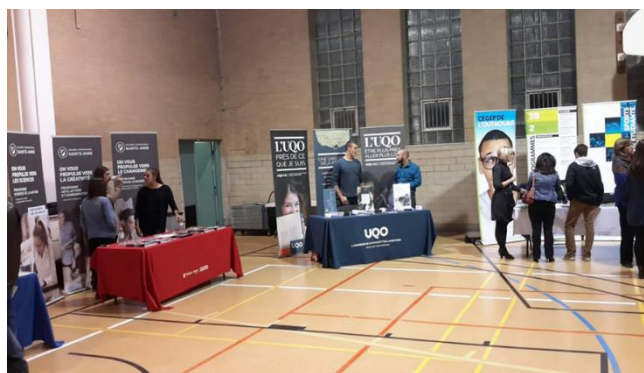
Salon de la formation

Environ trois cents finissants et parents de finissants ont participé au Salon de la formation. Dans le cadre de cette activité, chaque participant pouvait assister à quatre ateliers présentés par les établissements postsecondaires de la région. De plus, des universités québécoises étaient présentes au gymnase pour la soirée. En outre, près de deux cents parents d'élèves de la 4 e secondaire ont participé à une soirée d'information en orientation afin de les aider à accompagner leurs enfants dans leurs démarches d'orientation.