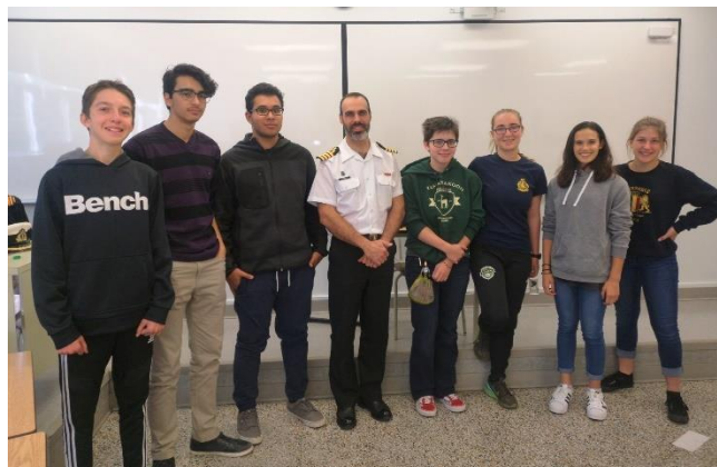
Salon des carrières

Durant la journée pédagogique du mois d'octobre, environ cent cinquante élèves de la 3 e à la 5 e secondaire se sont rendus au Collège pour participer au Salon des carrières. Les élèves présents pouvaient alors assister à un maximum de trois conférences de l'un des 20 travailleurs-conférenciers.