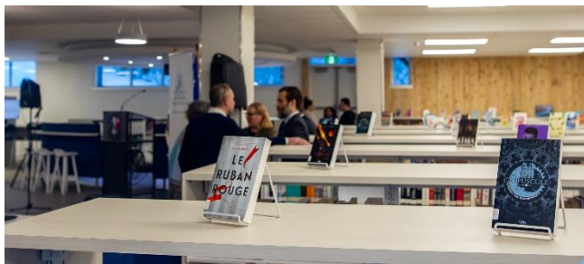
Ouverture officielle de la bibliothèque Pierre-Sanscartier