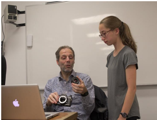
Club de photo