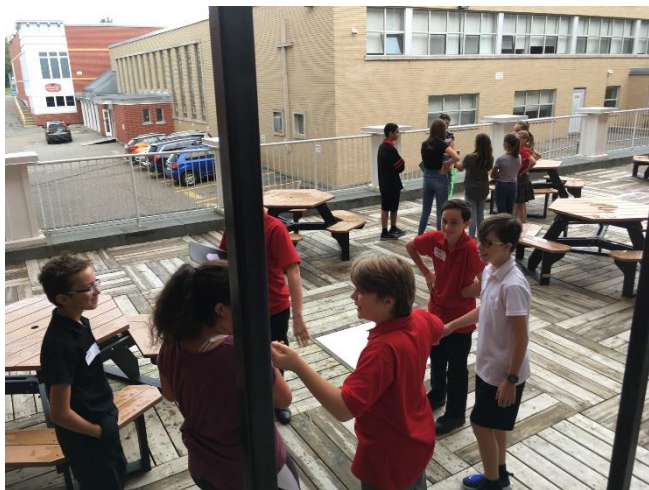
Soirée des Flos

La soirée des Flos a été animée par des élèves de la 4 e secondaire et une quinzaine d'élèves de la 1 re secondaire ont participé à l'activité.