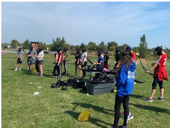
Journée Saint-Alexandre | Complexe Amigo

À la mi-septembre, le degré a tenu, par une belle journée ensoleillée, sa traditionnelle Journée Saint-Alexandre au Complexe Amigo. Tous les participants ont pu profiter de la piste de karting, jouer une partie de mini-golf sur le parcours Rigolfeur de même qu'expérimenter le Bubble soccer ou l' archery tag .