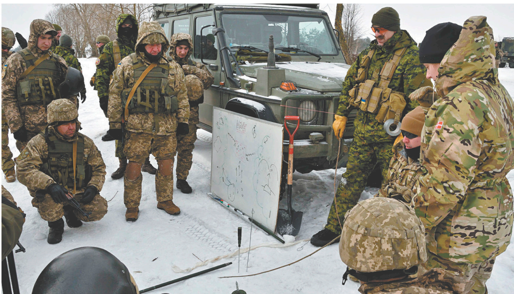
FORCE OPÉRATIONNELLE INTERARMÉES - UKRAÏNE

La mission d'entraînement UNIFIER, composée de 200 militaires canadiens en Ukraine jusqu'en 2019, est une contribution importante, voire essentielle, du Canada à la professionnalisation des forces ukrainiennes.