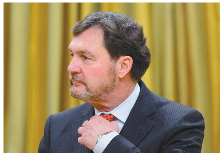
SEAN KILPATRICK LA PRESSE CANADIENNE

Les magistrats de la Cour suprême jugeront donc de la cause en utilisant la loi telle qu'elle est et non pas telle qu'elle pourrait être. Justement, le projet de loi C-33 propose de supprimer la condition de résider à l'étranger depuis moins de cinq ans pour avoir droit de vote.