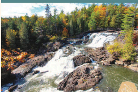
Chutes de Plaisance