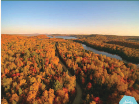
Rivière de la Petite-Nation