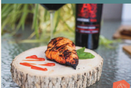
Les Produits David