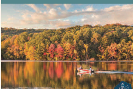
Pourvoirie de la Lièvre