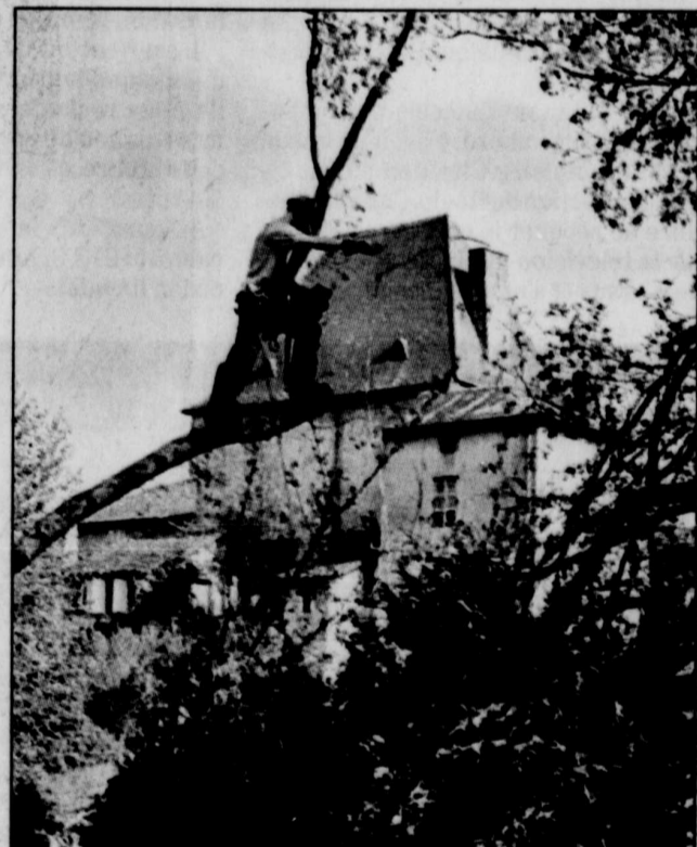
CENTRE DE FORMATION PROFESSIONNELLE DU TRAIT-CARRÉ