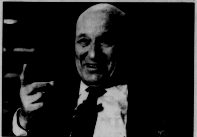
Frédéric Dard lors d'une entrevue télévisée, en 1991.