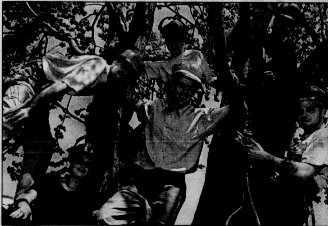
LE SOLEIL, PATRICE LAROCHE

CENTRE DE FORMATION PROFESSIONNELLE DU TRAIT-CARRÉ