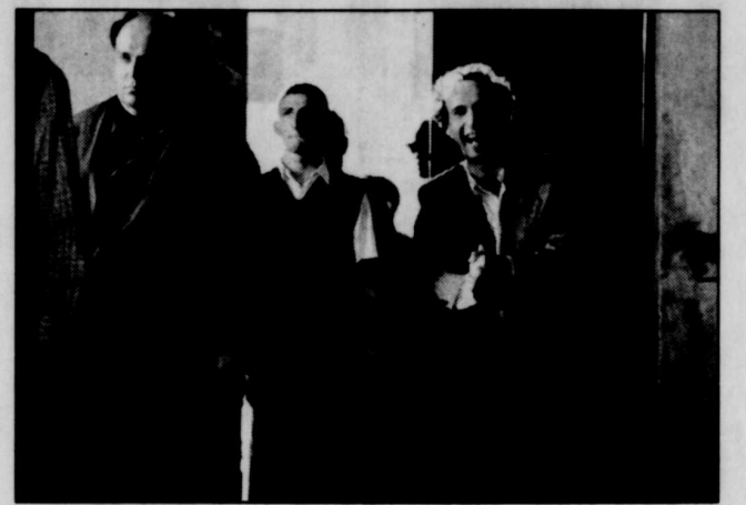
Roberto Benigni dans «La vie est belle».

Roberto Benigni a conquis le monde avec ce film à la fois drôle et bouleversant. Emmené dans un camp de concentration, un père fort imaginaire fait croire à son fils qu'il ne s'agit que d'un jeu. Tout dans ce film charme: les acteurs, la musique, l'histoire. Un grand film qu'il faut avoir vu. La vie est belle , Super Écran (F3) à 19h 15.