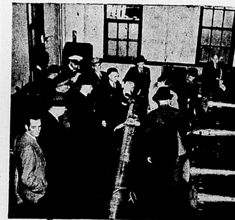
Les experts de la flotte canadienne préparent des torpilles mortelles pour les destroyers, pendant que les journalistes surveillent cette opération avec beaucoup d'intérêt.

ACHETEZ vos Cartes de Rapprochement de Guerre