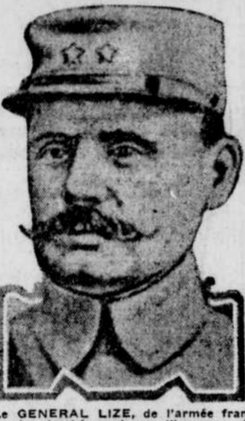
Le GENERAL LIZE, de l'armée française, tombé au champ d'honneur, récemment, en Italie, commandant de son sang l'union de deux grands peuples.