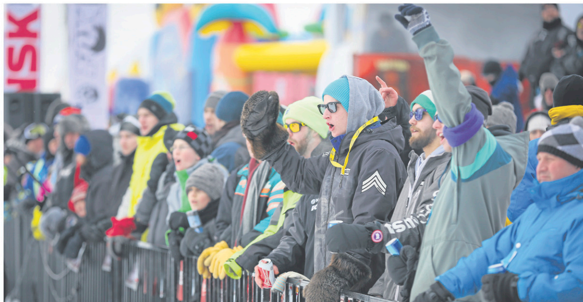
Selon le American Snowmobiler Magazine , le Grand Prix Ski-Doo de Valcourt est l'une des 10 courses de sports motorisés à voir dans une vie!

Les amateurs pourront eux aussi tenter leur chance sur la piste d'accélération le dimanche puisqu'on présentera pour la première des duels amicaux à tous ceux qui voudront se lancer le défi.