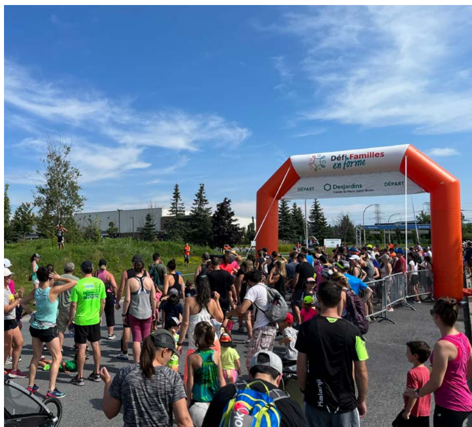
Plusieurs centaines de coureurs sont attendus ce dimanche à Saint-Bruno-de-Montarville.