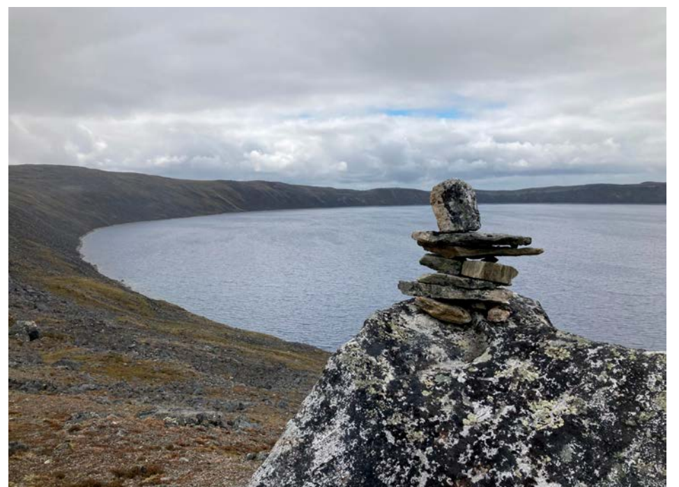
Les voyageurs visiteront le cratère des Pingualuit lors de leur expédition.

Le Plan Nous, dont le nom est un clin d'œil au Plan Nord, a pour but de créer des corridors humains entre les communautés du sud et du nord. Derrière cette initiative, la SNAP vise à protéger le territoire et la biodiversité, mais également les liens que les humains entretiennent avec le territoire. En créant des corridors humains, ce projet per-