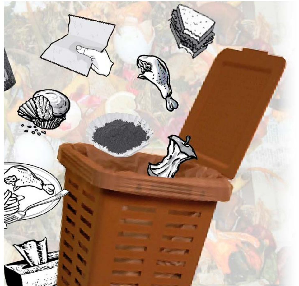
La collecte de matières résiduelles organiques est en vigueur à Saint-Bruno-de-Montarville depuis 2019.

Plus précisément, la Ville informe que les fruits et légumes, la viande, les os de viande, les produits laitiers, les pâtes alimentaires, les noix, les aliments frits et les condiments doivent être jetés dans le bac brun. En ce