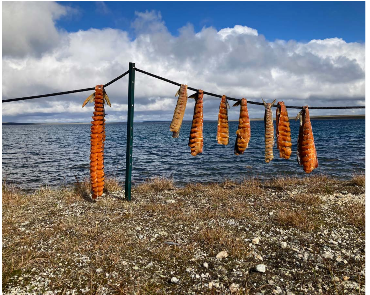
Le pitsik, un poisson légèrement salé, sèche au vent et au soleil devant le lac Manarsulik.