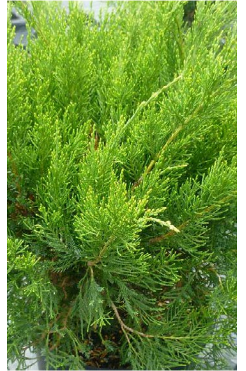
Le genévrier rampant Mint Julep.

En janvier 2021, j'écrivais que choisir certains de vos végétaux en fonction des quatre saisons rendait votre jardin plus vivant 12 mois par année.