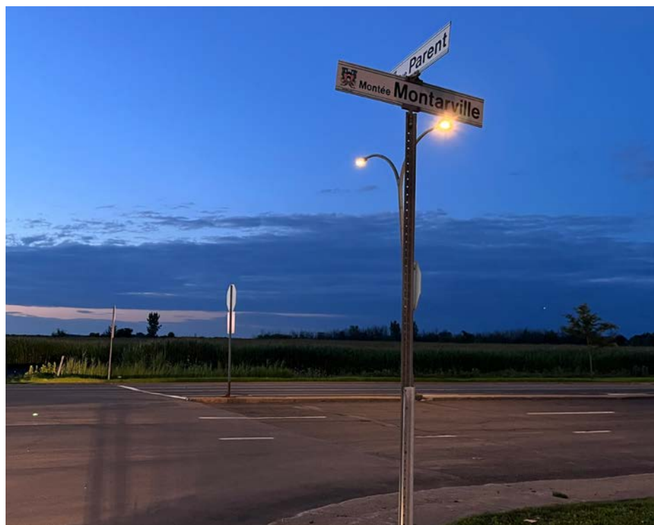
La rue Ponton n'a pas encore remplacé la rue Parent.

boulot. Nous étions à travailler le dossier, lorsque le maire nous a fait signe! Nous en sommes tous bien heureux! », nous confiait le fils, Richard Ponton.