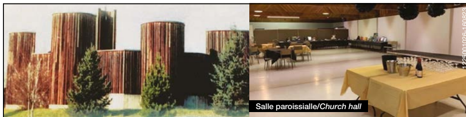
Salle paroissiale/Church hall

Église catholique St. AUGUSTINE of CANTERBURY à Saint-Bruno Unité pastorale anglophone de Saint Jean Paul II Notre église est ouverte au public et les messes sont célébrées les dimanches à 9h15 et les jeudis, aussi à 9h15.