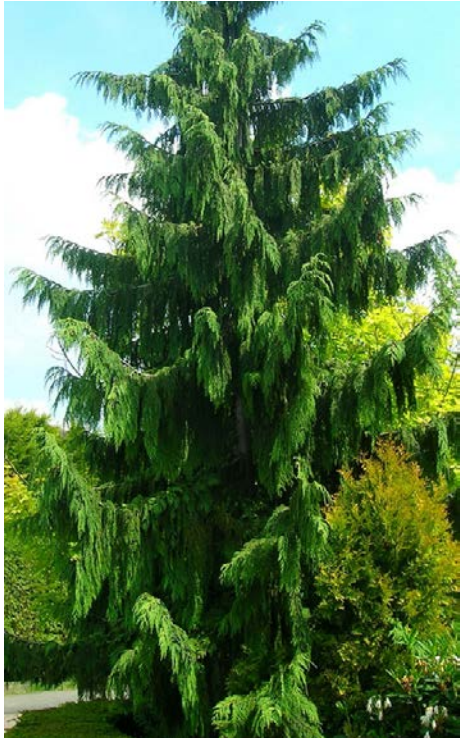
Le cyprès de Nootka pleureur.