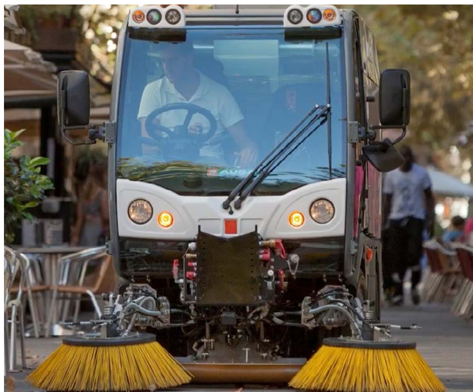
Exprolink s'installera à Saint-Bruno en janvier 2024.

Exprolink installera une toute nouvelle usine de production dans le domaine des véhicules électriques vocationnels (VEV) à Saint-Bruno-de-Montarville,