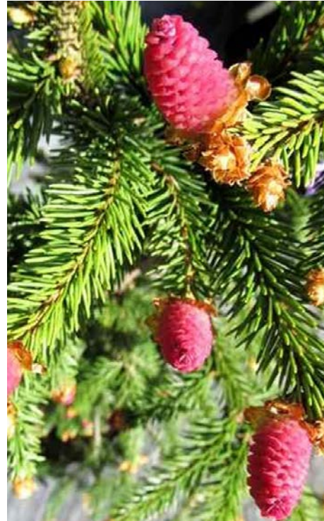
L'épinette de Norvège Acrocona.