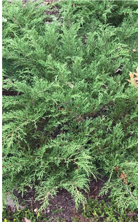
Le cyprès de Sibérie.