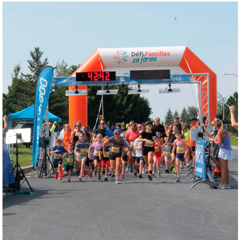
Différents départs auront lieu tout au long de la matinée.