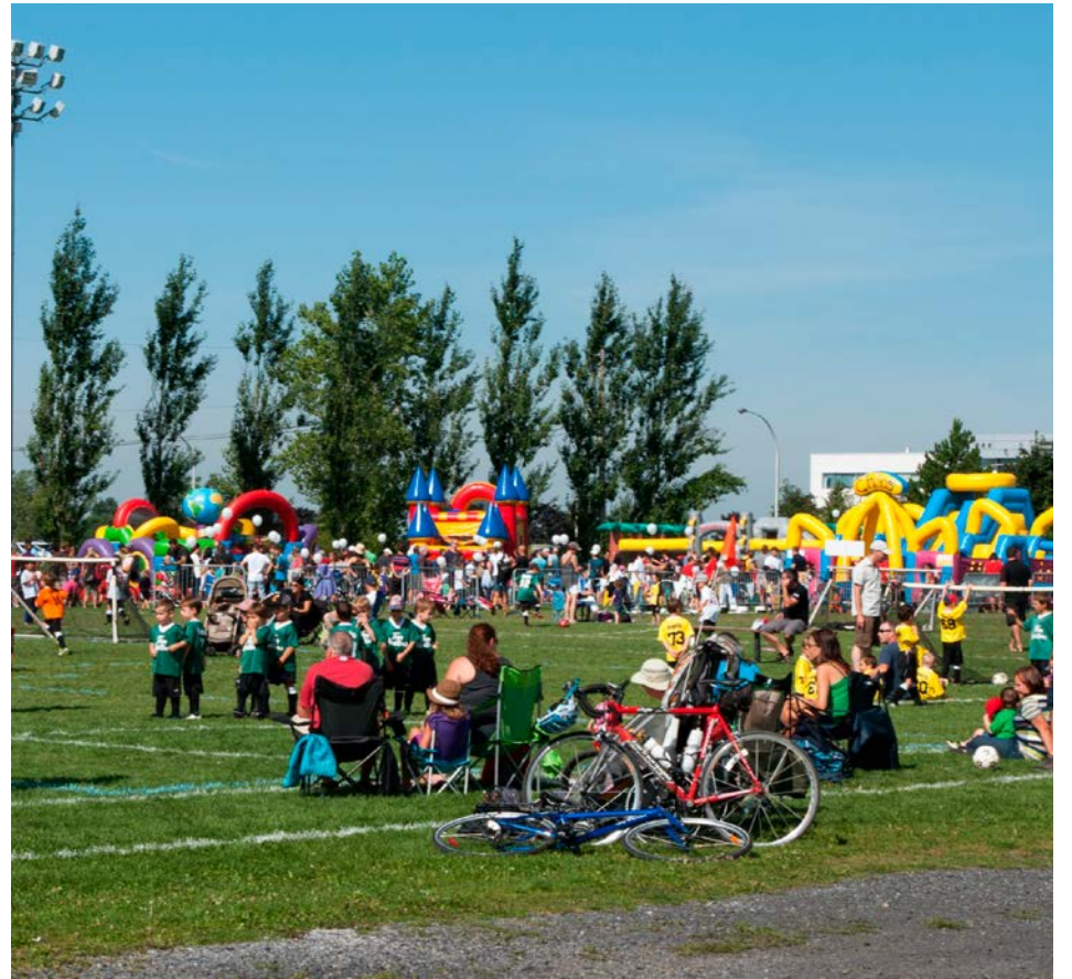
Animation, jeux gonflables, kiosques alimentaires, etc., seront de la fête. (Photo : courtoisie) (Photo : courtoisie)

La Ville de Saint-Bruno-de-Montarville invite ses citoyens à la traditionnelle Fête des parcs. Celle-ci aura lieu le 19 août, de 9 h à 16 h, au parc Marie-Victorin.