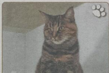
Nom : Angie Maîtresse : Émilie Falardeau-L. J'habite à Saint-Joseph de Beauce Âge : 3 ans

Je suis un Berger Allemand de couleur sable. Je suis née au Rhodes Island mais je demeure au Québec depuis l'âge de 12 semaines. J'adore rencontrer des nouveaux amis mais je suis une gardienne redoutable à la maison.