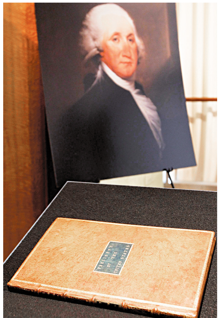
L'ouvrage, à la couverture de cuir blond, signé du président George Washington sur la première page, avait été spécialement relié pour lui en 1789, première année de son mandat présidentiel.