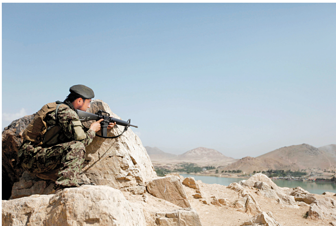
Ce soldat afghan a pris position sur une colline dominant le lac Qargha.

Kaboul et Washington ne cessent de critiquer Islamabad à ce sujet, l'accusant notamment de donner refuge aux talibans notam-