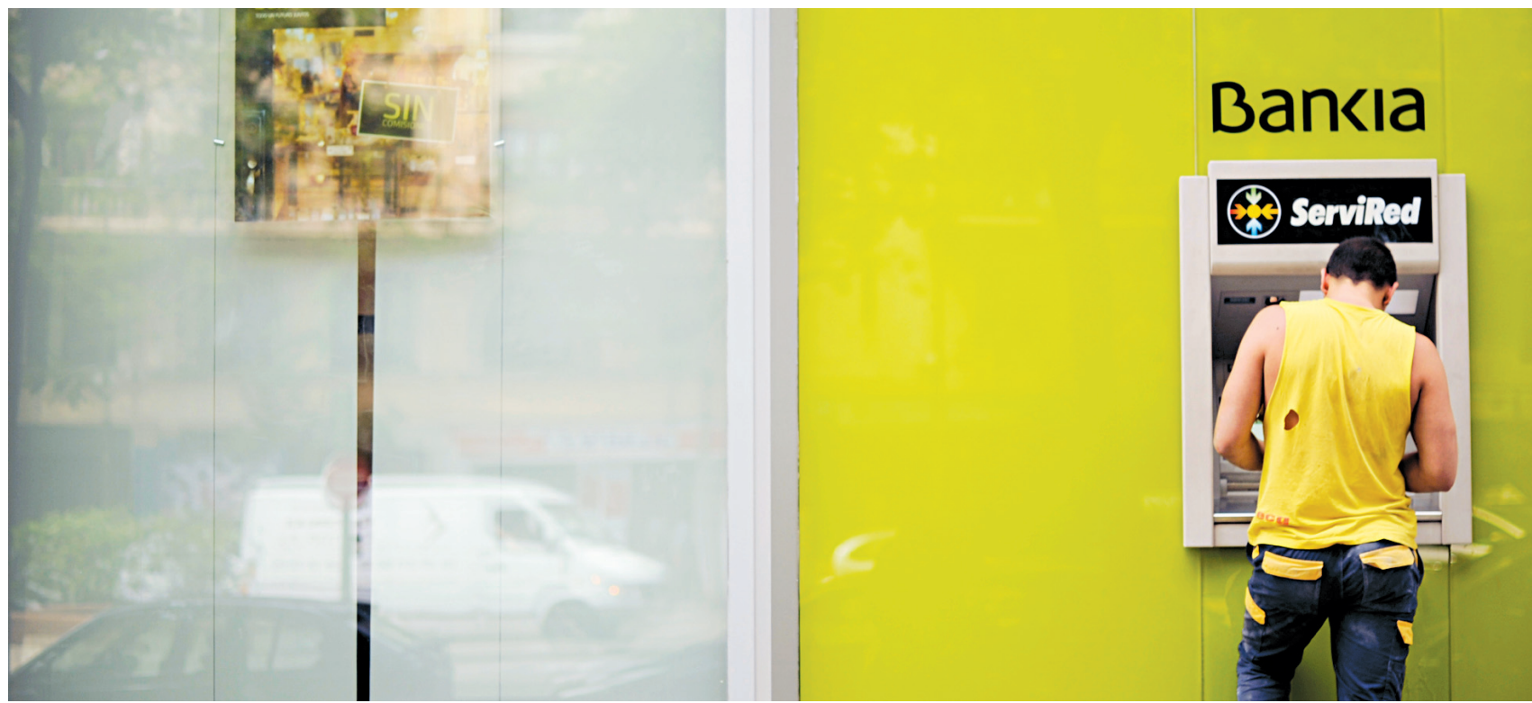
Un client de Bankia à un guichet automatique, à Madrid.

Les autorités espagnoles ont rendu publics jeudi les résultats des audits indépendants réalisés sur le secteur bancaire, qui chiffre ses besoins jusqu'à 62 milliards d'euros, un chiffre inférieur aux attentes du marché et aux 100 milliards proposés par la zone euro. Le ministre espagnol des Finances, Luis De Guindos, a dé-