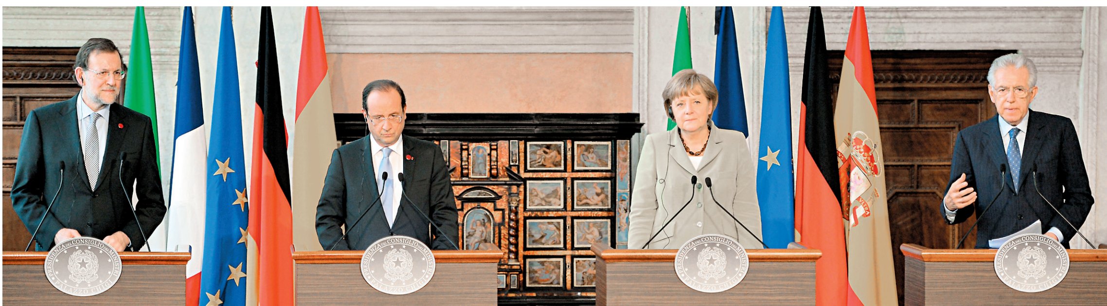
Mariano Rajoy (Espagne), François Hollande (France), Angela Merkel (Allemagne) et Mario Monti (Italie) ont tenu hier une rencontre préparatoire au sommet européen de la semaine prochaine.

CAHIER C · LE DEVOIR · LES SAMEDI 23 ET DIMANCHE 24 JUIN 2012