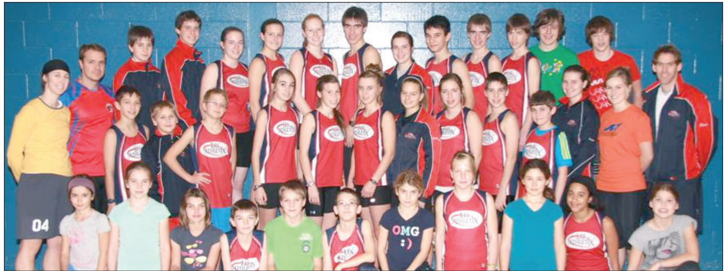
Les athlètes composant les Athlétix.

C'est à Sherbrooke, le 21 avril, qu'avait lieu la dernière compétition de la saison intérieure soit le championnat provincial scolaire d'athlétisme en