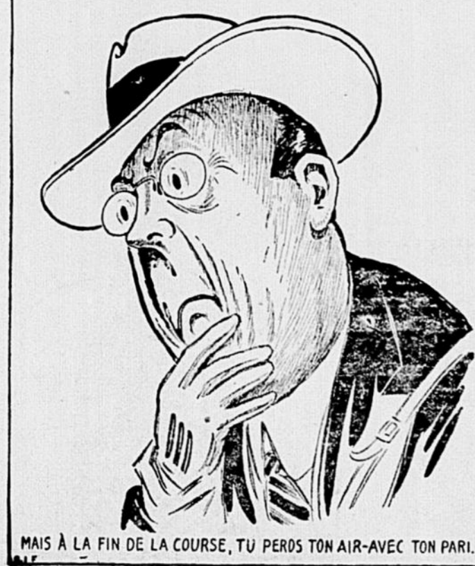
MAIS À LA FIN DE LA COURSE, TU PERDS TON AIR-AVEC TON PARL.