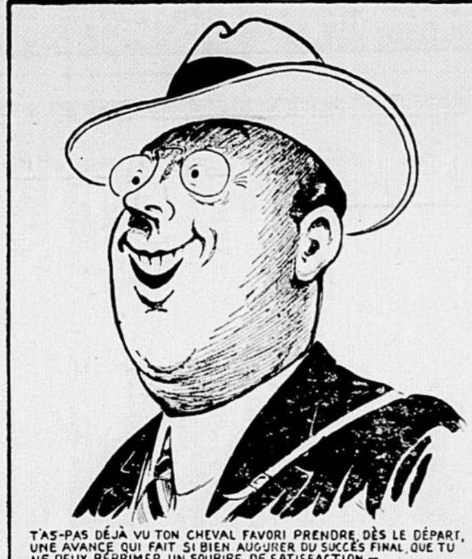
T'AS-PAS DÉJÀ VU TON CHEVAL FAVORI PRENDRE, DÈS LE DÉPART, UNE AVANCE QUI FAIT SI BIEN AUGURER DU SUCCÈS FINAL, QUE TU NE PEUX RÉPRIMER UN SOUIRE DE SATISFACTION —