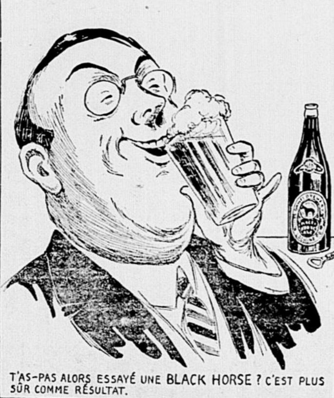
T'AS-PAS ALORS ESSAYÉ UNE BLACK HORSE ? C'EST PLUS SÛR COMME RÉSULTAT.