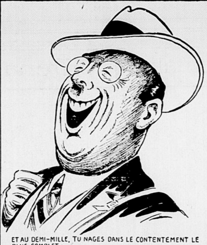
ET AU DEMI-MILLE, TU NAGES DANS LE CONTENTEMENT LE PLUS COMPLET —