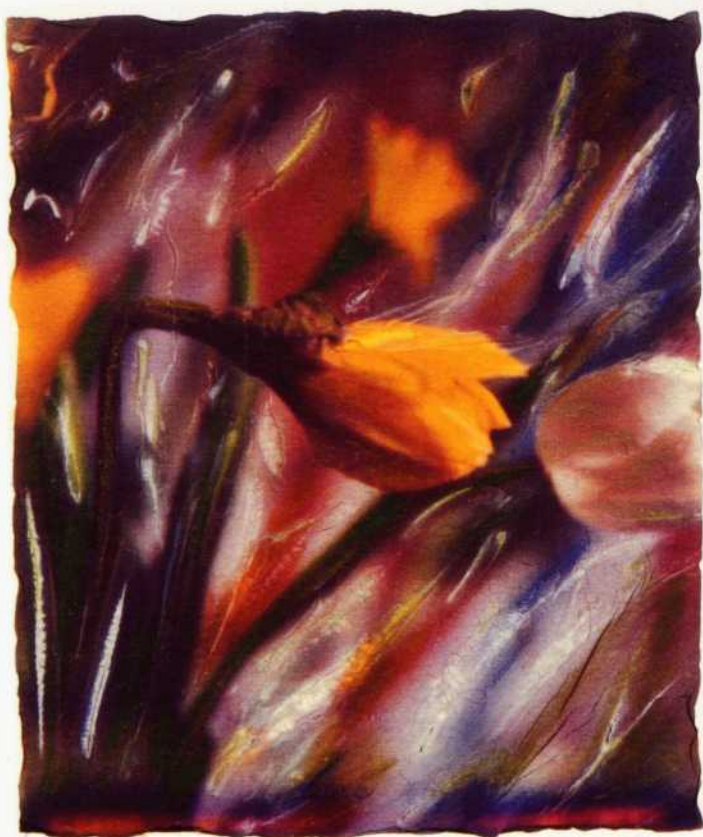
Jacqueline Martin Tulipes rêveuses 1999 Gilde graphique