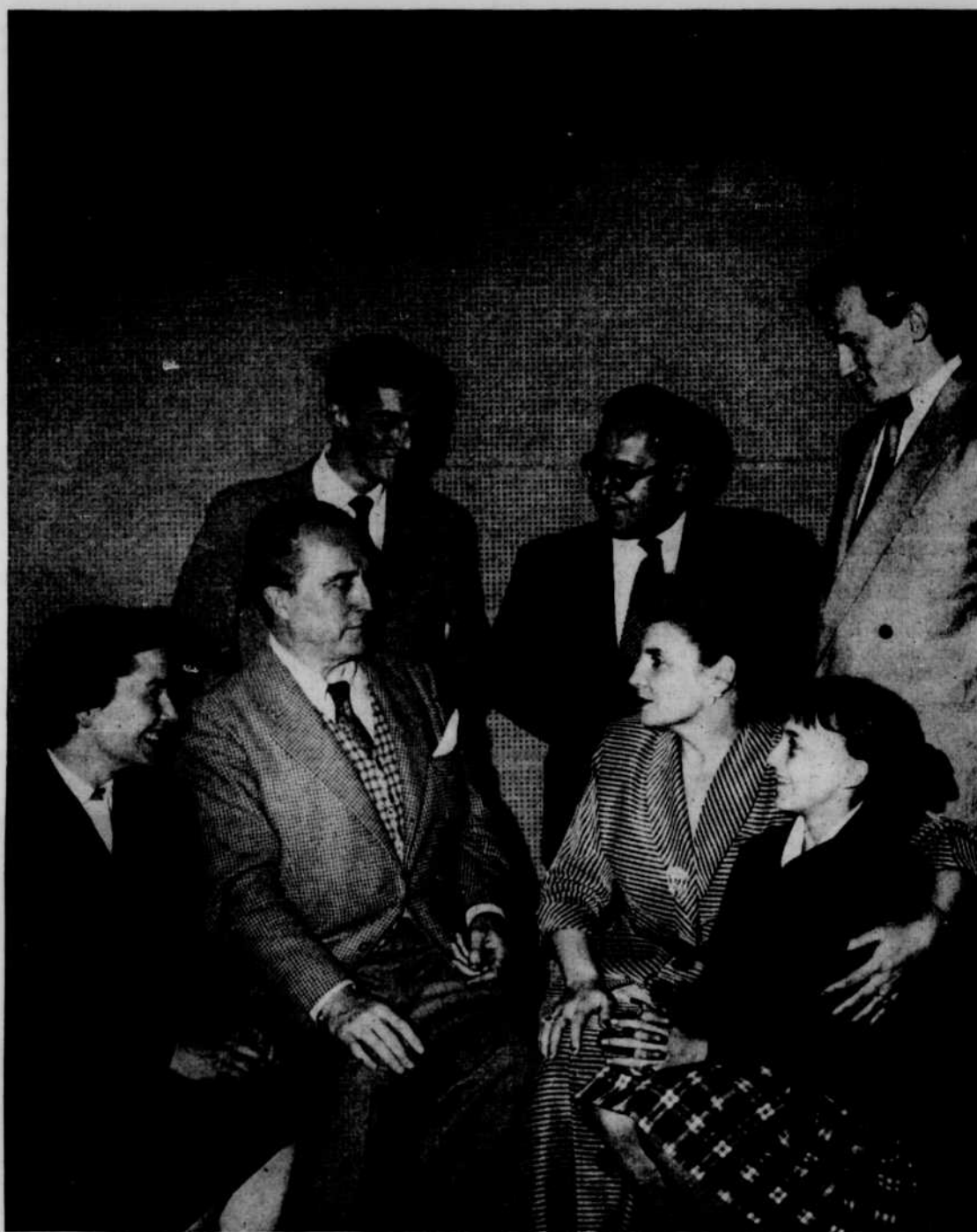
Interprètes de la Chronique des Pasquier

Baptiste et Marianne est une réalisation Guy Mauffette.