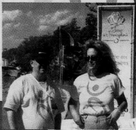
Équipe médicale canadienne