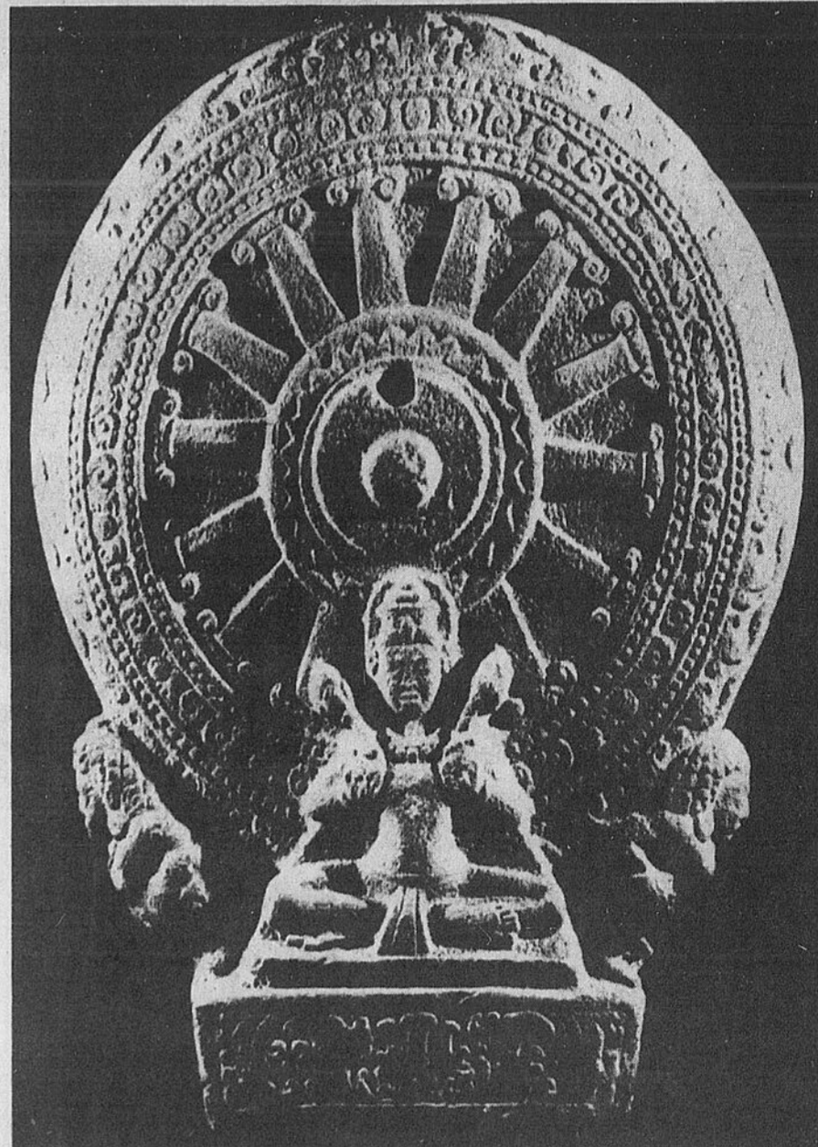
Roue de la loi

L'exposition se termine sur une série de photographies en couleurs des somptueuses peintures murales qui ornent les temples thaïlandais, mais qui se détériorent rapidement, notamment en raison du climat. Les organisateurs de l'exposition souhaitent qu'un effort particulier soit fait pour les sauvegarder.