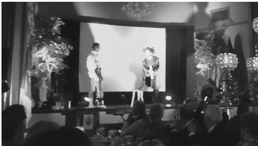
Gala d'ouverture du 400 e anniversaire, Sudbury, 2 mai 2015

et du Québec s'y réunissent, véritable happening spirituel auquel j'ai participé à plusieurs reprises).