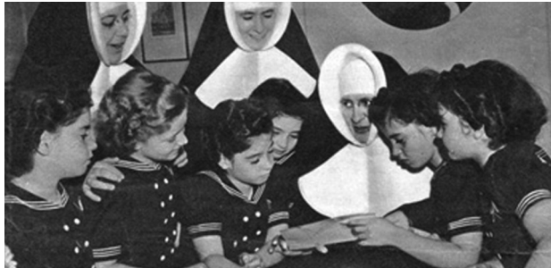
Les jumelles Dionne (plus une amie). La Patrie , 1942

Le pensionnat Villa Notre-Dame est intimement lié à l'histoire des jumelles Dionne, puisqu'elles y ont été accueillies dès son ouverture pour y faire leurs études secondaires.