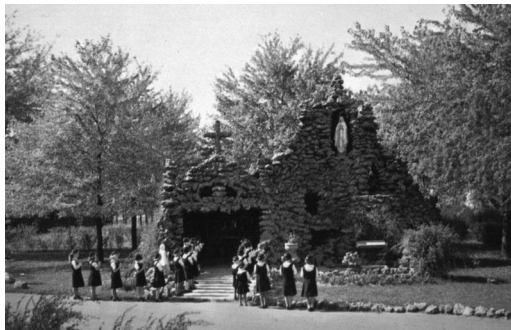
Grotte de l'Académie Sainte-Marie, Windsor

Le XX e siècle va s'ouvrir sur une bonne note pour la jeunesse franco-ontarienne grâce aux communautés religieuses qui n'épargnent ni le temps, ni les énergies, ni les ressources pour doter leur province d'adoption d'un solide réseau d'écoles. À Vankleek Hill, les Sœurs