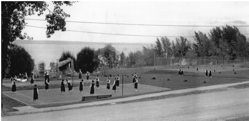
Le terrain de jeux et la grotte avec, en arrière-plan, le lac Témiscamingue (1953)