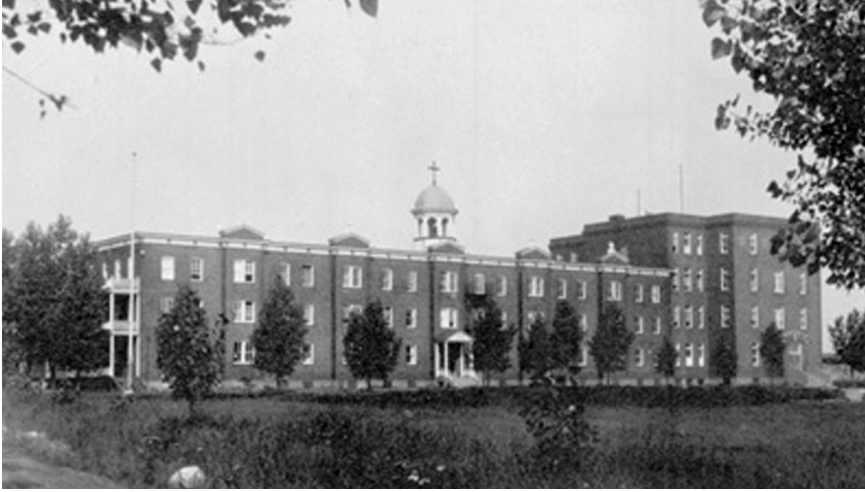
Collège du Sacré-Cœur

À partir de 1970 et jusqu'à 2002, je réside sur le campus avec la communauté jésuite, à l'emploi de l'Université de Sudbury durant 22 ans. Je serai de nouveau responsable de la paroisse Saint-Ignace de Loyola sur le campus de 2009 à 2015, après quelques années en paroisse (à Saint-Eugène et à Sainte-Anne-des-Pins, 2002-2010).