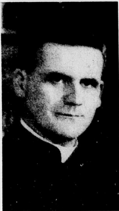
Mgr P.-E. LEGER

Quatre chiffres que nous avons certainement rencontrés dans cet ordre sur les feuilles d'un annuaire de téléphone ou d'un bottin de commerce. Pourquoi nous impressionnent-ils autant ce soir? Ah! C'est qu'ils ne désignent plus simplement un petit coin de cette terre que nous remuons, que nous travaillons et que nous transformons à nos petites mesures. Dans la série des siècles et des âges. Dans cette marche interminable vers un but mystérieux, ce soir, à minuit, l'humanité commencera la 1943 e étape de ce pèlerinage que l'ère du Christ a inauguré.