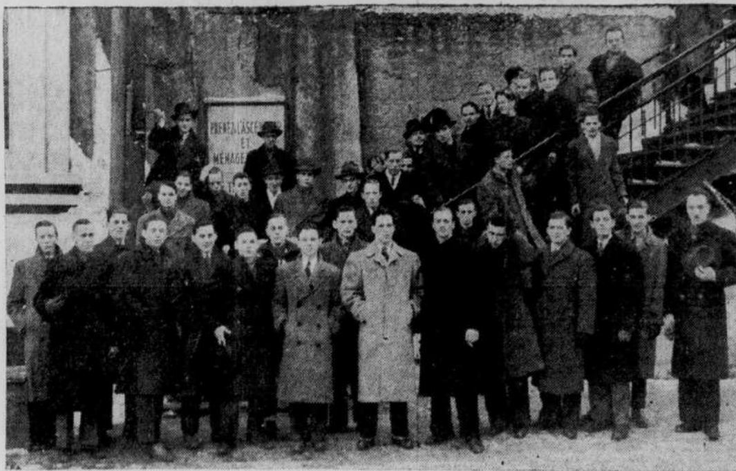
DES ETUDIANTS VISITENT "LE SOLEIL": Un groupe d'étudiants de l'Ecole Technique de Québec ont visité nos bureaux et nos ateliers hier. Les jeunes visiteurs ont pris beaucoup d'intérêt aux nombreuses opérations que nécessite la publication d'un grand quotidien. Sous la direction d'un employé de notre maison, ils ont passé par nos différents ateliers. Le fonctionnement de la machinerie a particulièrement retenu leur attention.

Northville, N. Y., 21. — (PA) Les cadavres de deux hommes en uniformes d'officiers de la marine britannique ont été trouvés hier sur la grève de Long Island. Le bureau de liaison navale britannique à New-York a dit que ces uniformes étaient sans doute ceux des membres de l'équipage d'un avion de la marine royale porté disparu quatre jours après son départ de l'aérodrome Floyd Bennett, N. Y., pour Brunswick, Maine, station aérienne de la Marine, samedi.