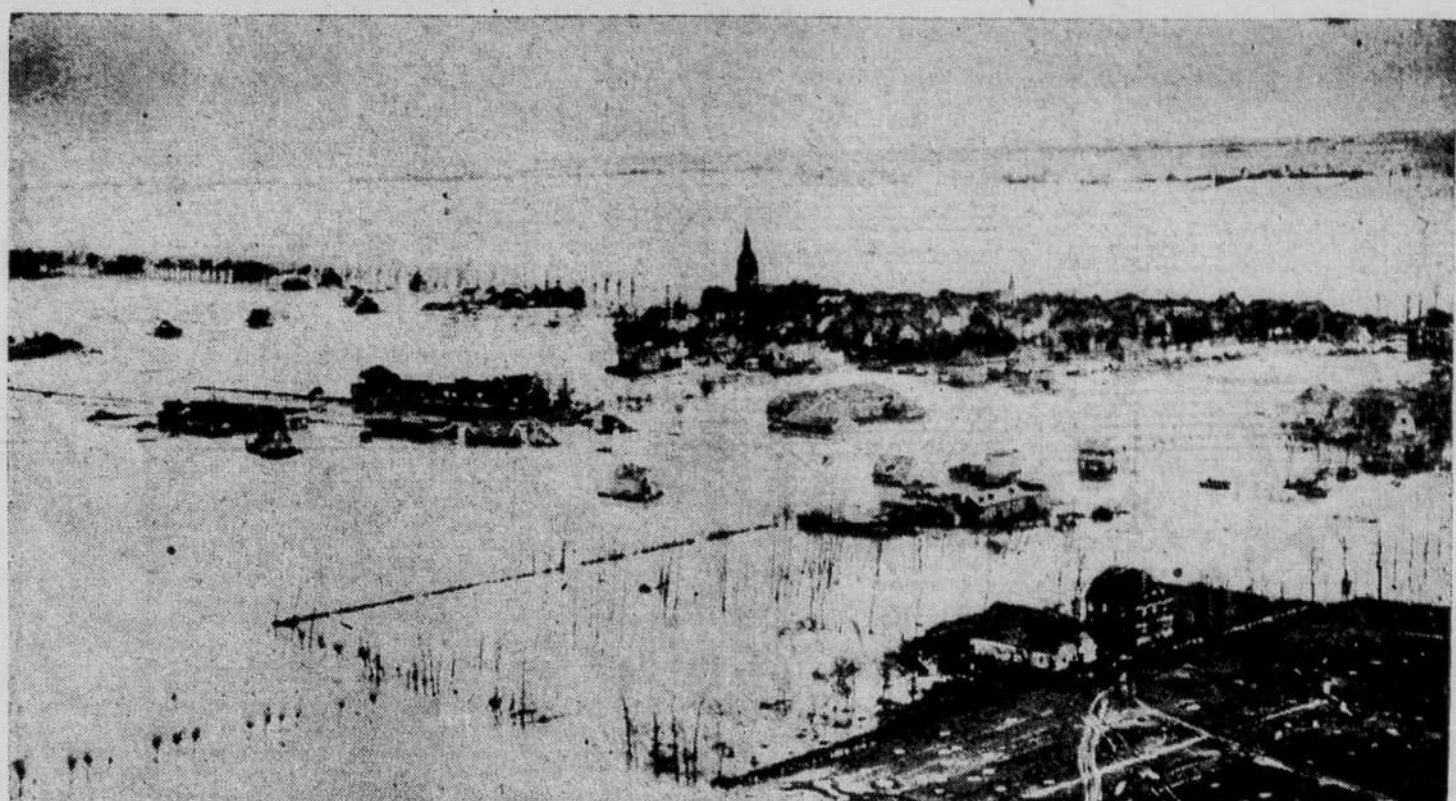
GUERRE AQUATIQUE POUR LES CANADIENS : Vue à l'ouest de Kranenburg, à cinq milles à l'est de Clèves. C'est dans cette région que combattait actuellement les troupes de la 1ère armée canadienne. Les inondations ont été provoquées par le dégel du mois de janvier et par la destruction des digues.

Candy, Ceylan, 21. (P.C.) — Les forces de la 14e armée britannique ont élargi leur tête de pont sur la rive gauche de la rivière Irrawadi dans le secteur de Myinmu à 35 milles au sud-ouest de Mandalay. Des fantassins, appuyés par des chars d'assaut, ont pris le village de Gaungou, quatre milles au sud de Myinmu. Des contre-attaques japonaises furent repoussées à Singhu à 40 milles au nord de Mandalay où les Britanniques ont fait des progrès satisfaisants. Des troupes du 15e corps hindou poursuivent des arrière-gardes ennemies qui retraitent vers le sud dans le secteur de Kangaw à l'est d'Akyab.