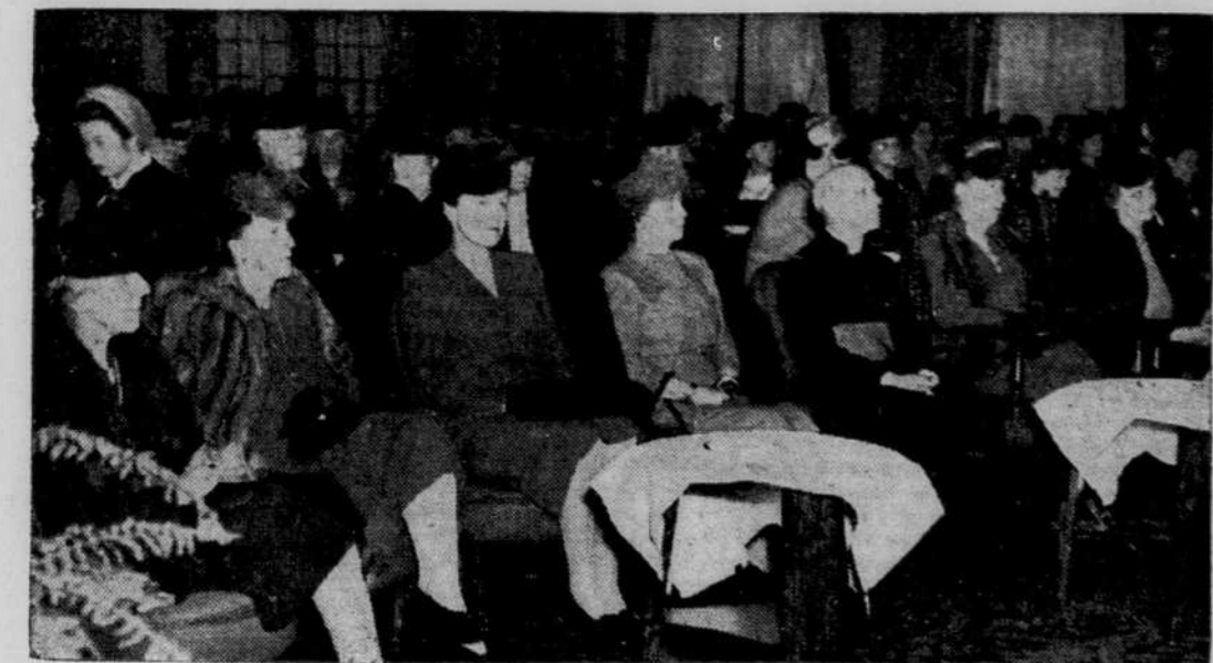
AU CERCLE DES FEMMES CANADIENNES : Un auditoire nombreux et élégant s'est pressé hier au Château Frontenac pour entendre l'honorable MALCOLM MACDONALD, haut-commissaire du Royaume-Uni au Canada qui a prononcé une causerie sur le Commonwealth et l'Empire Britannique.