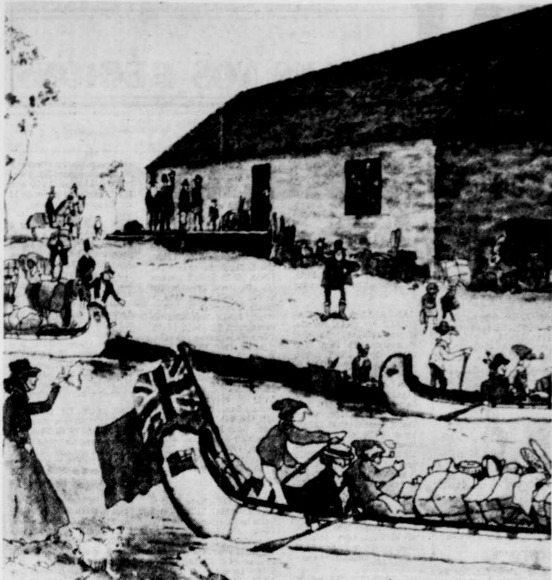
Le hangar de pierre de Lachine est réanimé pour témoigner de l'importance historique qu'acquiert la région montréalaise dans le commerce des fourrures au XVIIIe et au début du XIXe siècle.

En attendant, les bronzes des découvreurs du Mississippi, Louis Joliet et le père Marquette; de Robert Baldwin, un éminent parlementaire du XIXe siècle; de Pierre Boucher, ancien gouverneur de Trois-Rivières; des sieurs de La Vérendrye et d'Iberville, respectivement découvreur des Rocheuses et navigateur aventurier; et enfin de lord Dorchester, un gouverneur du XIXe siècle, ont été placés sur le parterre où les badauds pourront les examiner exceptionnellement de près.