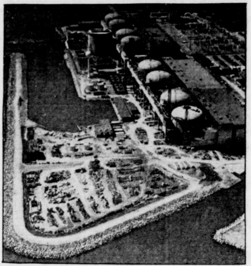
Hydro-Ontario s'inquiète de la disparition d'un deuxième "crayon" contenant de l'uranium, fortement radioactif. Elle ignore la raison pour laquelle ces derniers se sont volatilisés.

"La faillite du gouvernement d'effectuer des poursuites depuis le 1er février et la fermeture de la Commission du système métrique (mars 1985) signifie que les libéraux ont finalement compris le message que les gens ne veulent pas de mesures métriques", ajoute M. Domm.