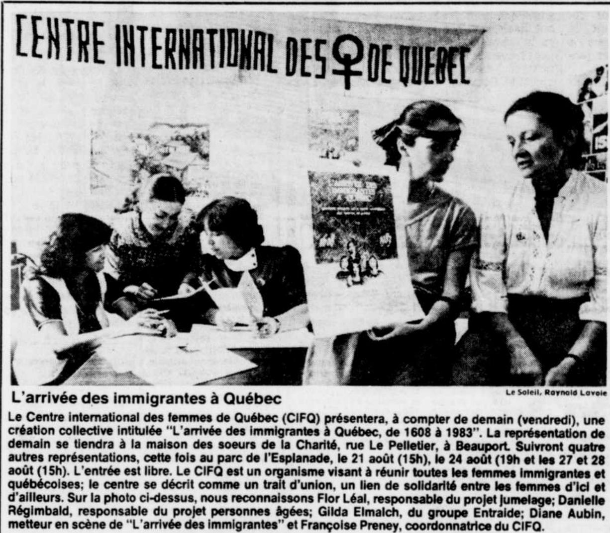
L'arrivée des immigrantes à Québec

REMERCIEMENTS au Saint-Esprit pour faveur obtenue avec promesse de faire publier H.T. REMERCIEMENTS au Saint-Esprit pour faveur obtenue avec promesse de publier J.D. REMERCIEMENT au Saint-Esprit pour faveur obtenue avec promesse de publier T.L. REMERCIEMENTS au Saint-Esprit pour faveur obtenue avec promesse de publier B.D.B. REMERCIEMENTS au frère André pour faveur obtenue avec promesse de publier D.F. REMERCIEMENTS au Saint-Esprit pour faveur obtenue avec promesse de faire publier T.G. REMERCIEMENT à la Ste-Vierge pour faveur obtenue avec promesse de publier O.H. REMERCIEMENTS au Saint-Esprit pour faveur obtenue avec promesse de faire publier J.B.C.M. SINCERES remerciements au pape Jean XVIII pour faveur obte-