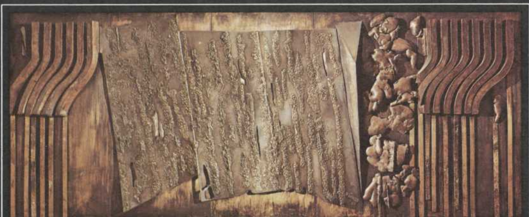
Murale de bronze de Peter Gnass

du 28 au 31 janvier 1976 du 1er au 29 février 1976