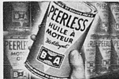
C'EST MAINTENANT le moment de changer la vieille huile usagée d'hiver pour de l'huile à Moteur Peerless B-A. Tout retard pourrait être désastreux! Conduisez demain à la grande enseigne B-A. Demandez de la Peerless.

VOUS POUVEZ ACHETER EN TOUTE CONFIANCE À LA GRANDE ENSEIGNE B-A