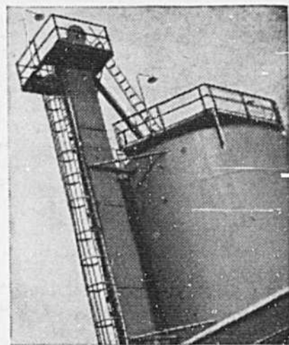
DISTILLATION à vide élevée... Procédé "Furtural" Solution M. E. K. Argille Catalyseur... Cette huile est obtenue par un procédé à 5 étapes qui produit l'huile de graissage la plus pure et la plus efficace qui soit. Puis vient la Séparation... qui fait subir un "alliage" à l'huile pour la protéger contre l'oxydation, tout comme le fer subit un alliage pour être protégé contre la rouille et donner l'acier inoxydable. Cette étape signifie que l'huile à Moteur Peerless tiendra le coup plus longtemps, gardera les moteurs plus propres, diminuera les frais de réparations et fera durer l'auto plus longtemps!

Cette année, ne tardez pas! Faites vite changer l'huile, avant que l'huile usagée et sale qui se trouve dans votre auto ne cause des ennuis sérieux! Et, quand vous faites ce changement, adoptez la Peerless, la nouvelle huile B-A, de fabrication canadienne, une huile obtenue par un procédé à 5 étapes, une huile produite par "alliage", qui n'encrassera pas le moteur de votre auto... et qui aidera à réduire les frais de réparations!